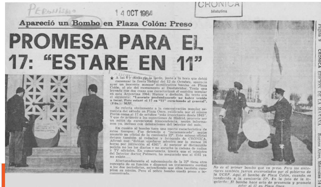
Figura 2. Recorte del artículo publicado el 14 de octubre, en la edición matutina (1964).