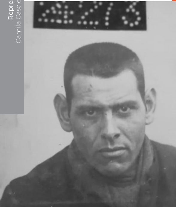
Figura 6. Penado N.º 286, Libro de Castigos del Penal de La Plata (1935-1945).