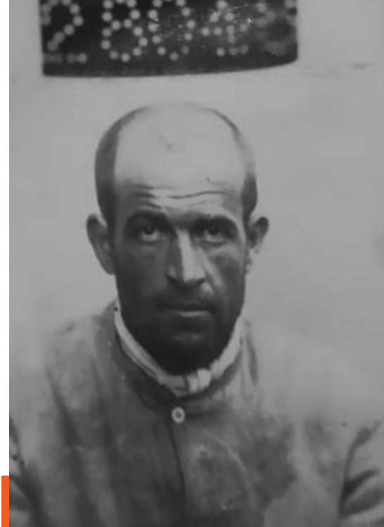
Figura 1. Penado N.º 165, Libro de Castigos del Penal de La Plata (1935-1945). Archivo Histórico del Servicio Penitenciario Bonaerense