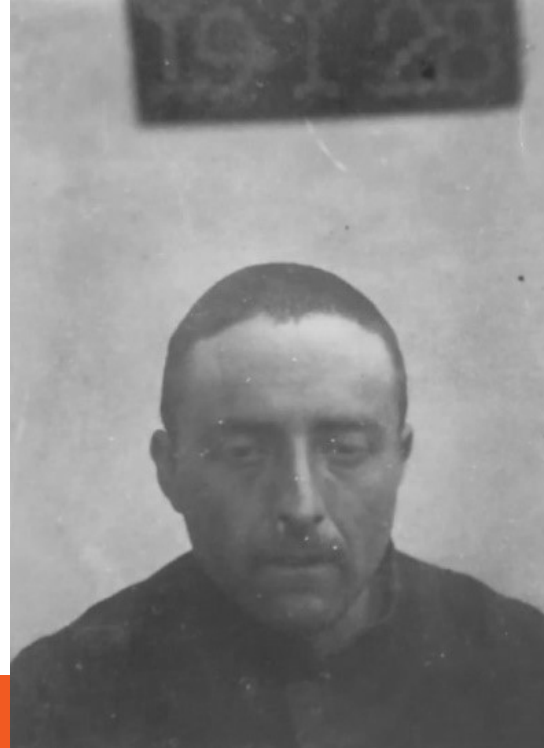
Figura 2. Penado N.º 436, Libro de Castigos del Penal de La Plata (1935-1945). Archivo Histórico del Servicio Penitenciario Bonaerense