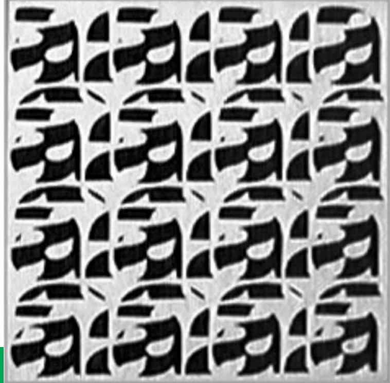
Figura 3. Tipografías III (1963/4), de Roberto Rollié. Colección: Diseño