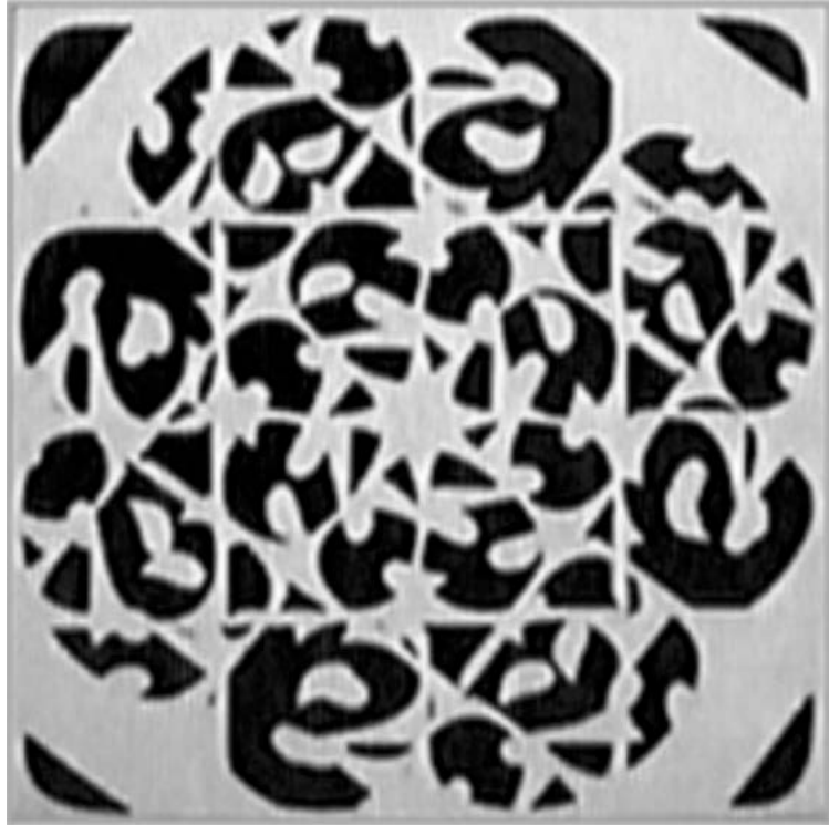
Figura 2. Tipografías II (1963/4), de Roberto Rollié. Colección: Diseño