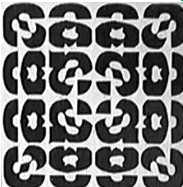
Figura 4. Tipografías IV (1963), de Roberto Rollié. Colección: Diseño