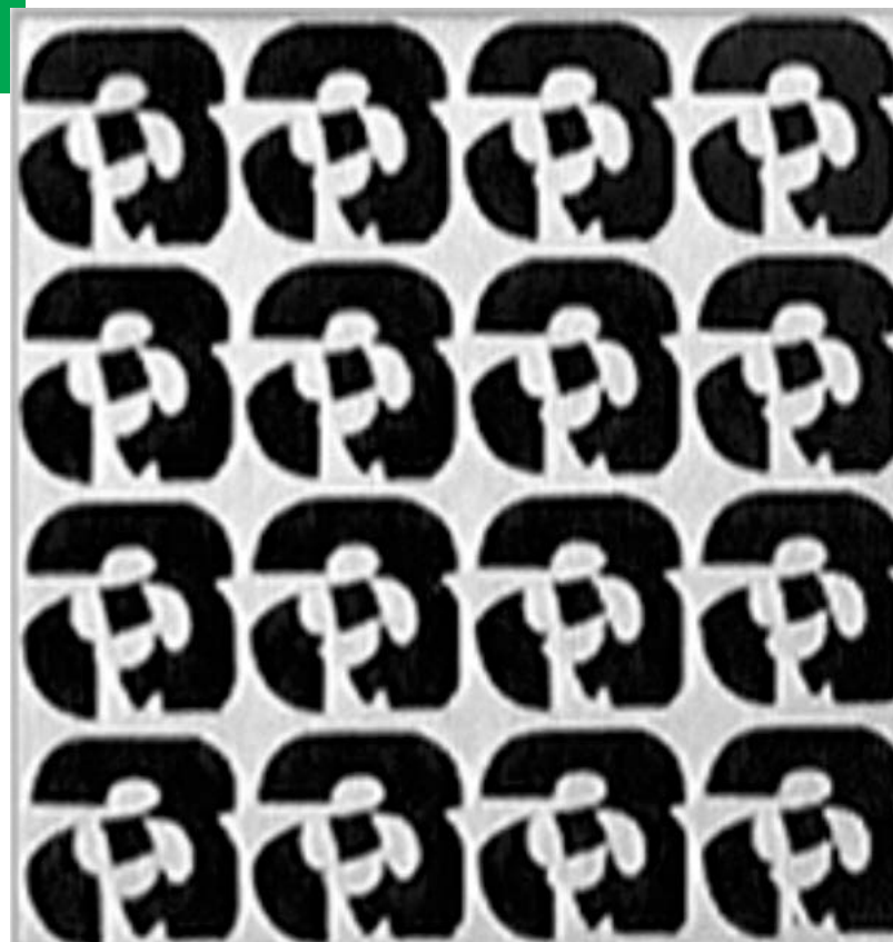
Figura 1. Tipografías I (1963), de Roberto Rollié. Colección: Diseño

participación central como parte del Centro de Experimentación Visual en la muestra Sistemas (1970) que, según Branda, «plantea una nueva propuesta de la Experimentación visual vinculada al Diseño». Las obras catalogadas en el CD como «Experiencias Visuales» [Figuras 1 a 4] combinan el diseño, el uso y la experimentación tipográfica con la abstracción propia del arte óptico y el arte concreto de Maldonado. Paradójicamente, en las piezas de diseño se ven las mayores alteraciones, ya que tanto al momento de realizar la exposición como en la posterior producción del CD, se escinde su carácter seriado, su potencial publicitario y su contexto, ya que se exponen los primeros dibujos o pinturas de modo aislado. Puede plantearse nuevamente la reinterpretación sobre las obras entre la producción