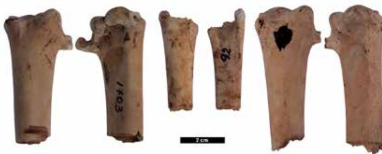
Figura 5. Cara anterior y posterior de tres fragmentos proximales de húmero de albatros. Se observan las huellas de aserrado perimetral.

Es importante mencionar el hallazgo de tres porciones proximales de húmero de albatros en el sitio, con excelente estado de conservación. Los tres especímenes muestran huellas de marcado perimetral en el borde de la fractura, ubicada en la región proximal de la diáfisis (Fig. 5). Por su morfología y por las evidencias de actividades antrópicas, se presume que se trata de desechos de confección de preformas de cuentas cilíndricas de collar.