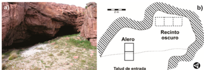
Figura 2. : a) Vista desde el talud de entrada del sitio Cueva del Negro, al frente se observa el sector denominado alero y al fondo, hacia el interior, el recinto oscuro de la cueva; b) vista en planta del sitio e intervenciones estratigráficas realizadas. En el alero se excavaron dos cuadrículas sistemáticas, y en el recinto oscuro tres cuadrículas sobre sedimentos removidos y alterados por saqueo.

El sitio Cueva del Negro (Fig. 1 y 2) es un conchero de alta potencia (más de dos metros) ubicado en un abrigo rocoso en la costa norte de la provincia de Santa Cruz. Consta de un alero en su parte más externa y en su interior un recinto subcircular denominado “recinto oscuro”. El registro arqueológico de este último presenta evidencias de alteraciones por saqueo, mientras que en el sector del alero la secuencia estratigráfica se halla intacta (Beretta et al. 2011, 2013a; Zubimendi et al. 2011). Hasta el momento, este sitio se encuentra fechado por ^{14}\text{C} entre 1170 \pm 110 y 1730 \pm 80 años AP (Zubimendi et al. 2011 y 2015a), lo que estaría indicando que la cueva fue ocupada en el límite de lo que hemos definido como Holoceno tardío inicial y final, durante un lapso de tiempo relativamente breve, a lo largo de unos pocos cientos de años, no pudiéndose diferenciar distintos eventos o momentos de ocupación (Beretta et al. 2011; Zubimendi et al. 2011).