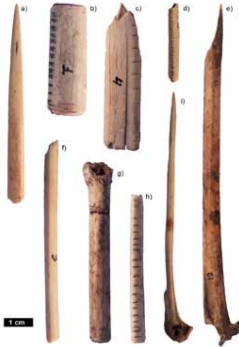
Figura 4. Instrumentos y objetos de adorno manufacturados sobre huesos de aves: a) Pieza 1; b) Pieza 3; c) Pieza 6; d) Pieza 7; e) Pieza 8; f) Pieza 5; g) Pieza 9; h) Pieza 4; i) Pieza 2.

Pieza 9 (Fig. 4.g): es un fragmento proximal-medial de carpo-metacarpo izquierdo de albatros que muestra huellas de cercenamiento perimetral; en la región medial de la diáfisis se observa seguida de la ruptura del hueso y en la porción proximal de la diáfisis sólo se encuentra la marca de aserrado. Podría tratarse de una preforma de cuenta cilíndrica.