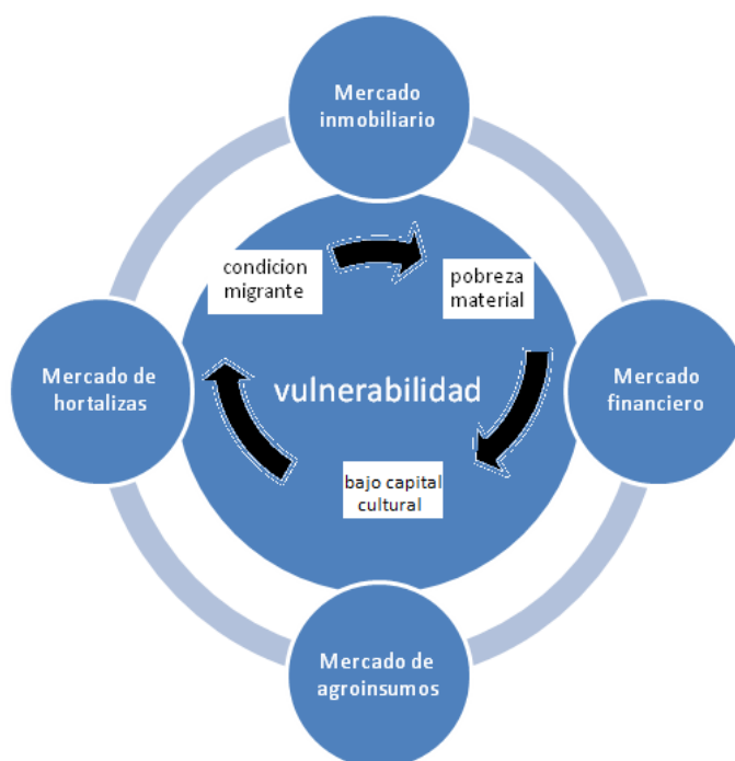
Figura 3: Vulnerabilidad de las familias bolivianas en la cadena hortícola