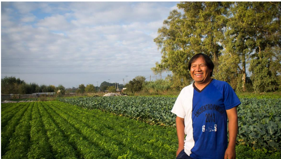
Fotografía 2: Productor de origen boliviano en el cinturón hortícola de La Plata