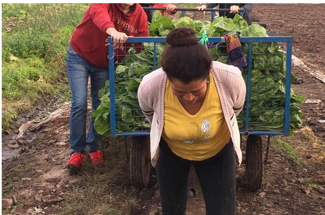
Fotografía 4: Trabajos pesados realizados por mujeres