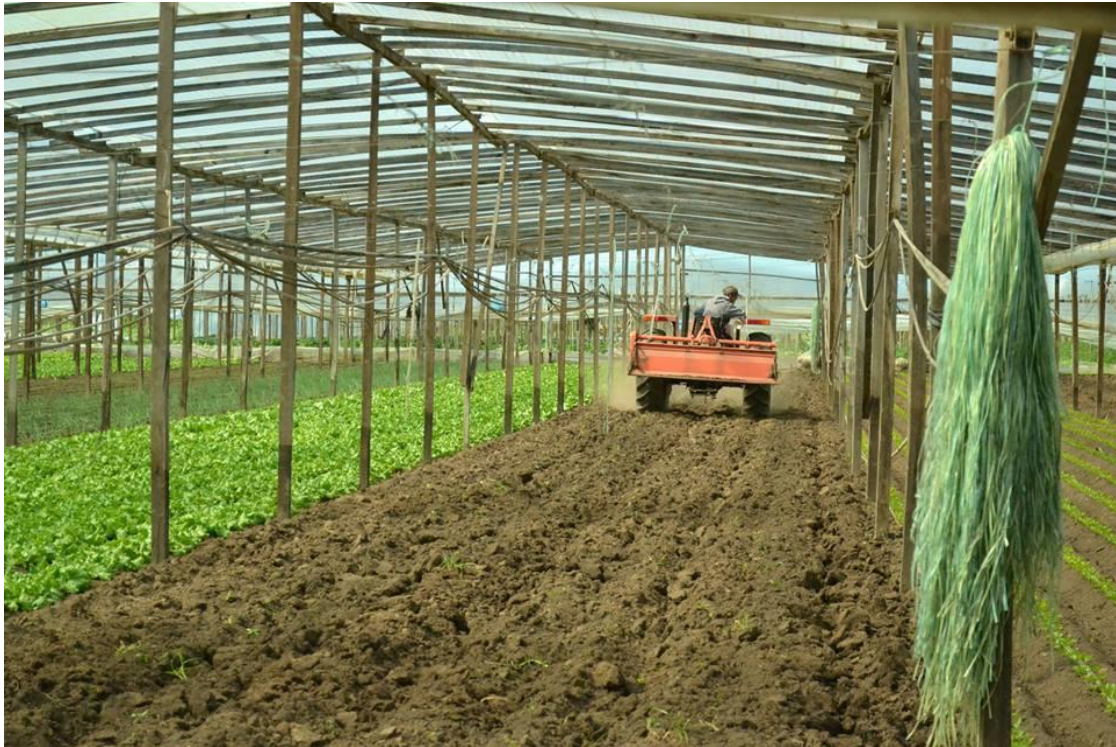
Fotografía 1: Trabajo de la tierra en invernáculos en el cinturón hortícola platense

Fuente: fotografía propia (agosto, 2015)