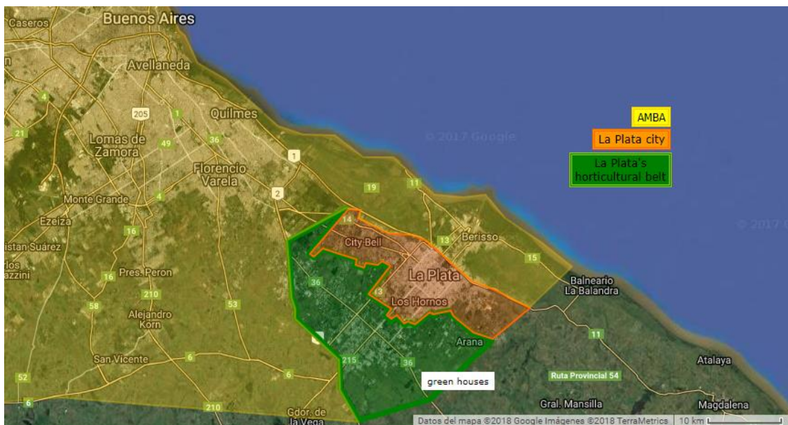
Mapa 3: CHP en el AMBA. Elaboración propia sobre imágenes de Google maps. Notar que en la parte sombreada de verde, lo blanco corresponde a la superficie cubierta con invernáculos.

Al sur del AMBA se encuentra nuestra área de estudio, el cinturón hortícola de La Plata (CHP) (Mapa 3), que es en la actualidad una de las regiones productoras de hortalizas más competitivas y dinámicas del país, ya que abastece de alimentos frescos no sólo a esta gran aglomeración próxima a Buenos Aires, sino también a otros centros urbanos a nivel nacional.