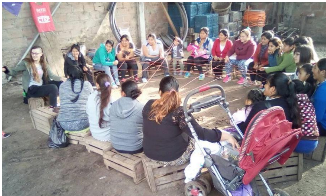
Fotografía 9: Ronda de mujeres. Dinámica de presentación "tejiendo una red"