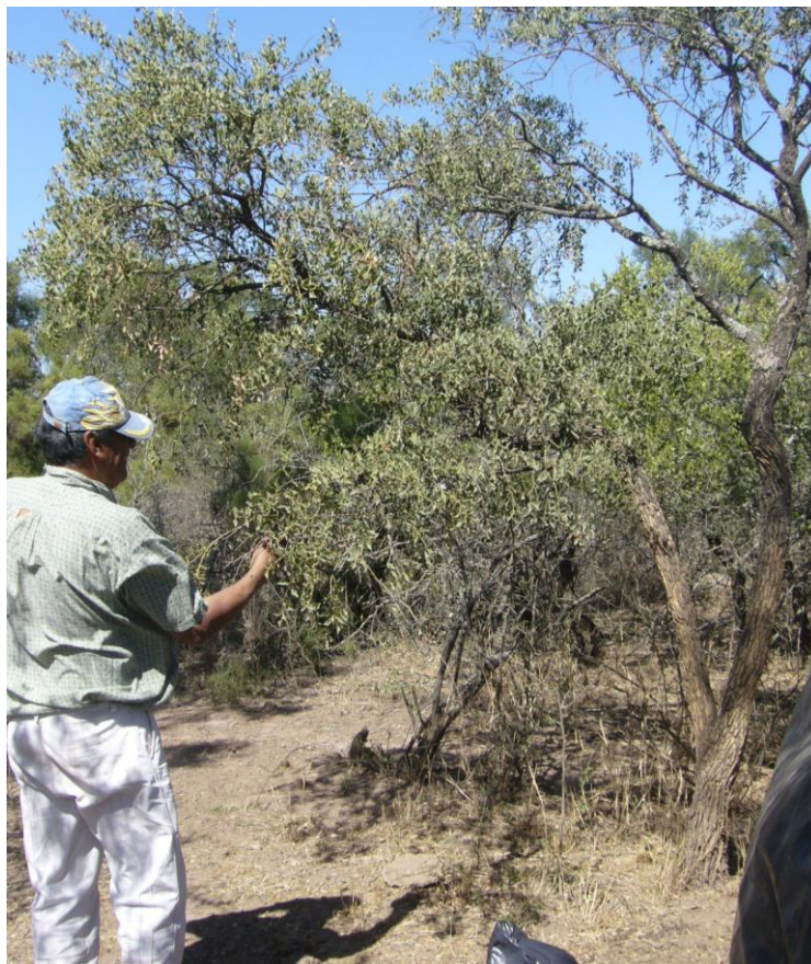
Figura 2 Caminata etnobotánica

de las plantas, los saberes relacionados a los usos de esas plantas, la vigencia de tales usos, es decir, si actualmente las seguían usando o no, y en algunos casos se indagó sobre formas de uso o partes de las plantas utilizadas. Finalizada esta etapa inicial del trabajo, se procedió, en los viajes siguientes, a la aplicación de entrevistas abiertas y semiestructuradas para indagar sobre aspectos específicos, como vigencia del uso, partes de las plantas utilizadas, formas de preparación y administración. Para esto se utilizaron fotos de visitas anteriores y tablas con nombres locales de plantas y en algunos casos se realizaron nuevas caminatas.