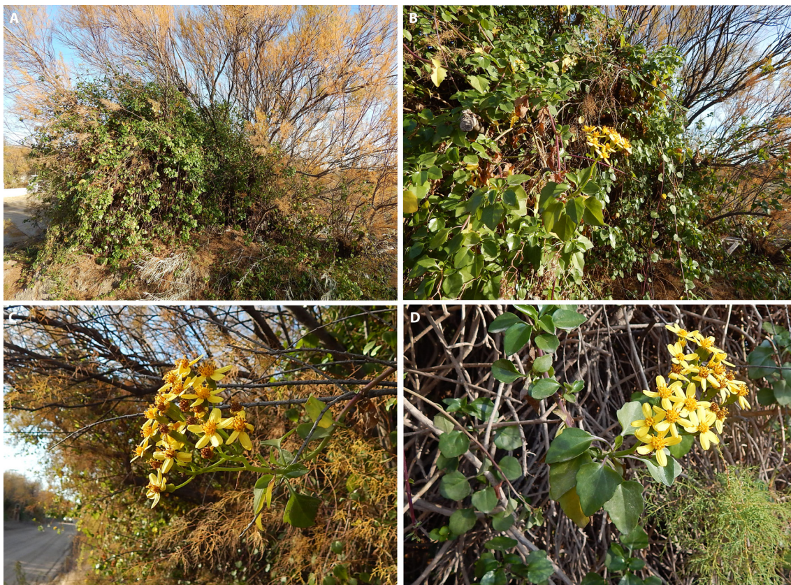
Fig. 2. Senecio angulatus en Monte Hermoso, Provincia de Buenos Aires (N. D. Bayón 1656). A: Aspecto de las plantas sobre Tamarix . B: Aspecto de las ramas en floración. C: Detalle de la inflorescencia. D: Detalle de las hojas y capítulos.

madre. En el partido de Villa Gesell, según las observaciones aportadas por la Dra. A. M. Faggi (com. pers.), la especie se desarrolla en condiciones similares, en la vegetación de las dunas costeras.