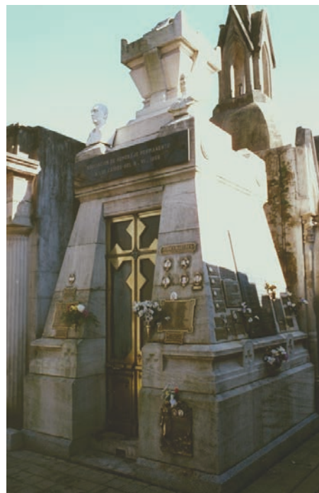
Figura 2. Panteón de Homenaje a los caídos el 9 de junio de 1956.

Elsa Abadie, en ese momento concejal municipal, y Graciela Zanetta, hijas de los mártires, en otra placa de homenaje conjunto elaboran un discurso más formalizado, porque en él se abarca a todos los partícipes del levantamiento, con lo cual adquiere características de homenaje a la resistencia peronista.