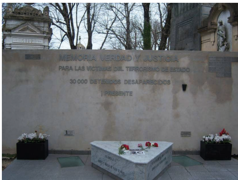
Figura 4. Mausoleo Memoria Verdad y Justicia.

Consta de una cripta que aloja a los allí inhumados, una losa sobre la que se ha colocado una plataforma triangular de mármol con inscripciones y un muro, en el que se encuentra inscripta la frase: