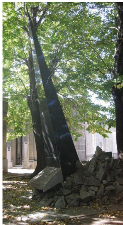
Figura 3. Monumento a los Desaparecidos y No Identificados.

El monumento fue erigido con posterioridad al primero, como resultado de la recuperación de los restos de desaparecidos platenses por parte de los profesionales del Equipo Argentino de Antropología Forense en otros cementerios. Este grupo fue organizado por la Comisión Nacional sobre la Desaparición de Personas (CONADEP) y las Abuelas de Plaza de Mayo en 1986, como una organización no gubernamental y sin fines de lucro.