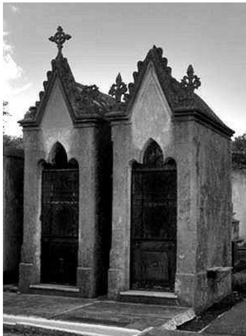
Figura 7. Pequeños panteones neogóticos