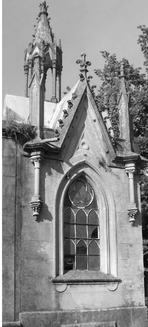
Figura 5. Ventana ojival.

seleccionaron dos bóvedas contiguas, de pequeño tamaño (Figura 7). Por ocupar dos lotes pequeños de 1,50 m por 2 m, carecen de cripta. Los profesionales actuantes fueron constructores habilitados, pero sin título.