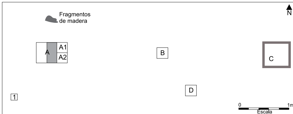
Figura 1. Esquema en planta del área excavada.

Posteriormente se procede a delimitar la zona de excavación y se realiza un planteo de cuadrículas (Figura 1). Se comienza a excavar la cuadrícula A de 2x2m. La tarea se realiza diferenciando en niveles artificiales de 0,10m contemplando las irregularidades que plantea la estratigrafía natural.