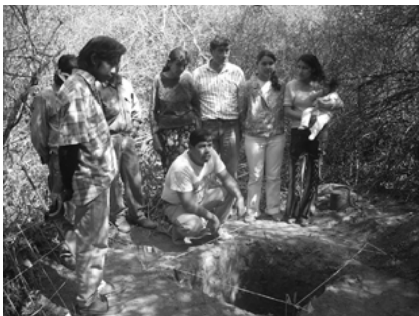
Figura 2. Oración previa a la exhumación de restos óseos.