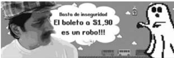
Imagen 2. Flyer virtual de la campaña "Hacé como José" (2009).