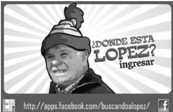
Imagen 3. Flyer promocional de juego-aplicación "Buscando a López", colectivo LULI (2010-2011)