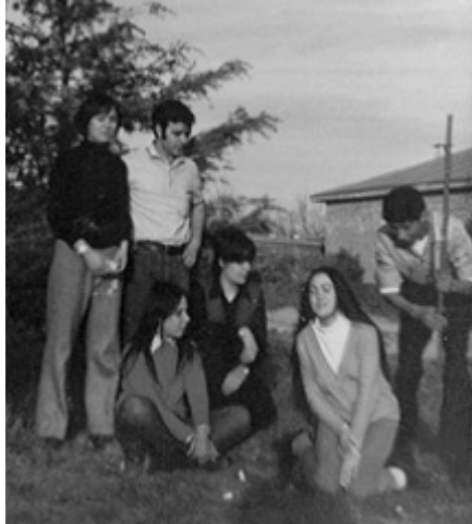
Integrantes de Cáritas.

precio accesible los textos de lectura obligatoria solicitados por los docentes. En este sentido, el criterio de la institución era que sus recursos debían provenir del trabajo y no de fuentes que resultaran contradictorias con el Evangelio (Néstor Navarro, Zulma). Toda la actividad se acompañaba con reuniones de revisión de la tarea y de oración, en las que el grupo compartía la lectura del Evangelio y de documentos eclesiales.