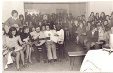
El coro y la misa en La Pequeña Obra.