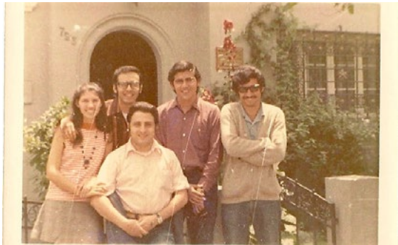
Miembros del SLA en la sede de Lima, 1971-1972.