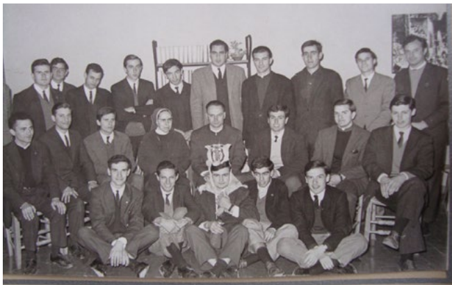
La Pequeña Hermandad, 1967.

Volviendo a la JUC bahiense, los jóvenes eran, en su mayoría, estudiantes de distintas carreras de la UNS o bien alumnos y egresados de la Escuela de Servicio Social, de la Escuela de Enfermería y del Instituto Juan XXIII. Algunos jucistas habían hecho sus estudios secundarios en colegios religiosos de la ciudad –fundamentalmente, en el Don Bosco, perteneciente a la Congregación Salesiana, y La Inmaculada, a cargo de la Compañía de María–, o de sus lugares de origen –dirigidos por diversas congregaciones y órdenes (salesianos, maristas, jesuitas o franciscanos capuchinos)–, y contaban con una trayectoria de militancia previa en el MFC, la Legión de María, 106 La Pequeña Hermandad 107 o las ramas juveniles de la ACA.