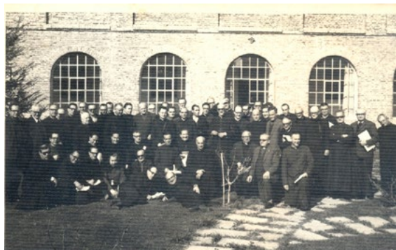
Reunión del clero local en el Seminario La Asunción, 1968.