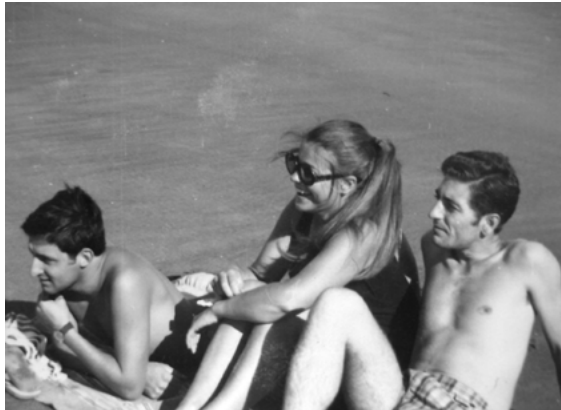
Jucistas en un campamento en la playa.

Por otra parte, en el verano, la JUC, la JOC y la JEC, respectivamente, compartían campamentos o encuentros anuales en los que se preparaban temas de formación, reflexión y revisión grupal, se leían y discutían documentos del Concilio, de Medellín y publicaciones del MIEC-JECI, y se constituían en momentos importantes de socialización para los jóvenes. Estos se realizaron en Pehuen-có o en Villa La Inmaculada. 113