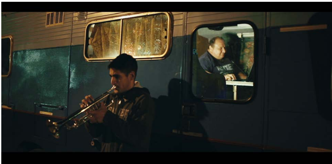
Figura 4. Fotograma de Cuerpo de Letra (D'Angiolillo, 2015)