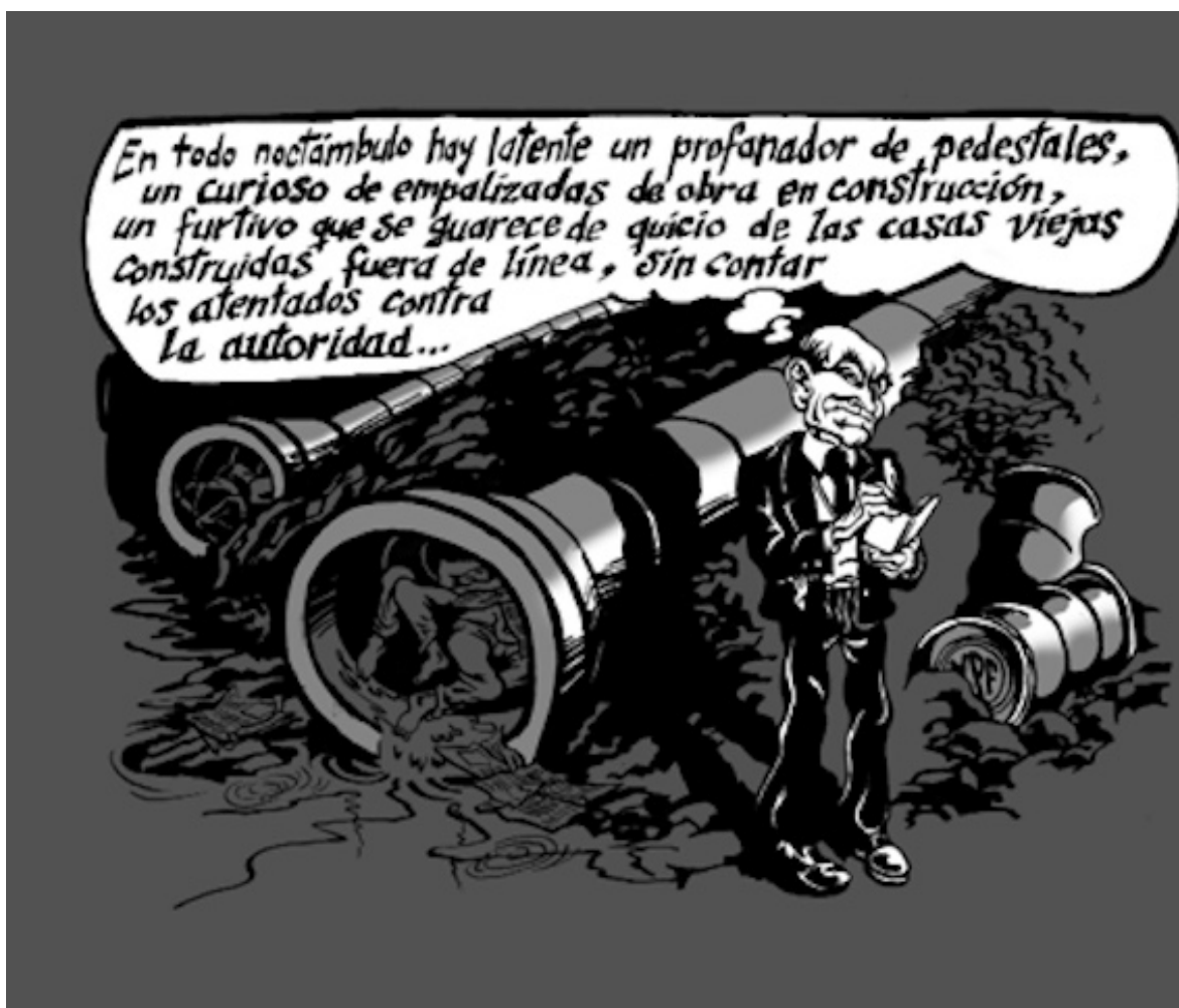
Figura 1. Dibujo de D'Angiolillo publicado en su libro La desplaza. Biogeografía del Parque Rivadavia (2006)

Por eso es fascinante participar, ser testigo y, a veces, resulta necesario resistir esa especie de declinación natural, cuando el espacio es lavado de sentido, despersonalizado como un Metrobús, olvidada su memoria. Por más residuales que sean ciertos rincones de la ciudad, ese momento histórico les será inevitable, sea gentrificación o como se llame. Estos espacios intermedios, autopistas y rotondas, son diseñados para ser usados solo por automóviles, pero terminan mostrando signos de vida y desarrollan su propia fauna, seguramente contraria a lo diverso ; como bien dicen, es lo que consigue crecer en el desierto de hormigón para finalmente sobrevivir. Un proceso vital y a veces traumático para su comunidad, aunque solo sean yuyos o plantas salvajes.