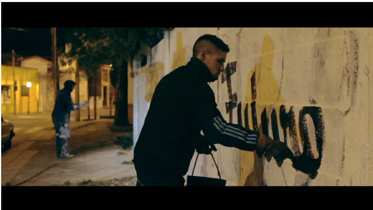
Figura 3. Fotograma de Cuerpo de Letra (D'Angiolillo, 2015)

Es interesante el lugar desde el cual los personajes interpelan al espectador invitando a repensar ciertas asunciones acerca de la cultura y el arte. Pueden reconocerse en este grupo de aprendices, maestros y trabajadores atentos al trazo, al equilibrio o a la proporción de la escritura, atributos similares a los que hacen de la caligrafía japonesa un arte. A la vez encarnan ciertas formas de organización caídas en desuso en las sociedades capitalistas actuales, como la formación en oficios o la lucha territorial. ¿Cómo fue la elección de los sujetos del documental?