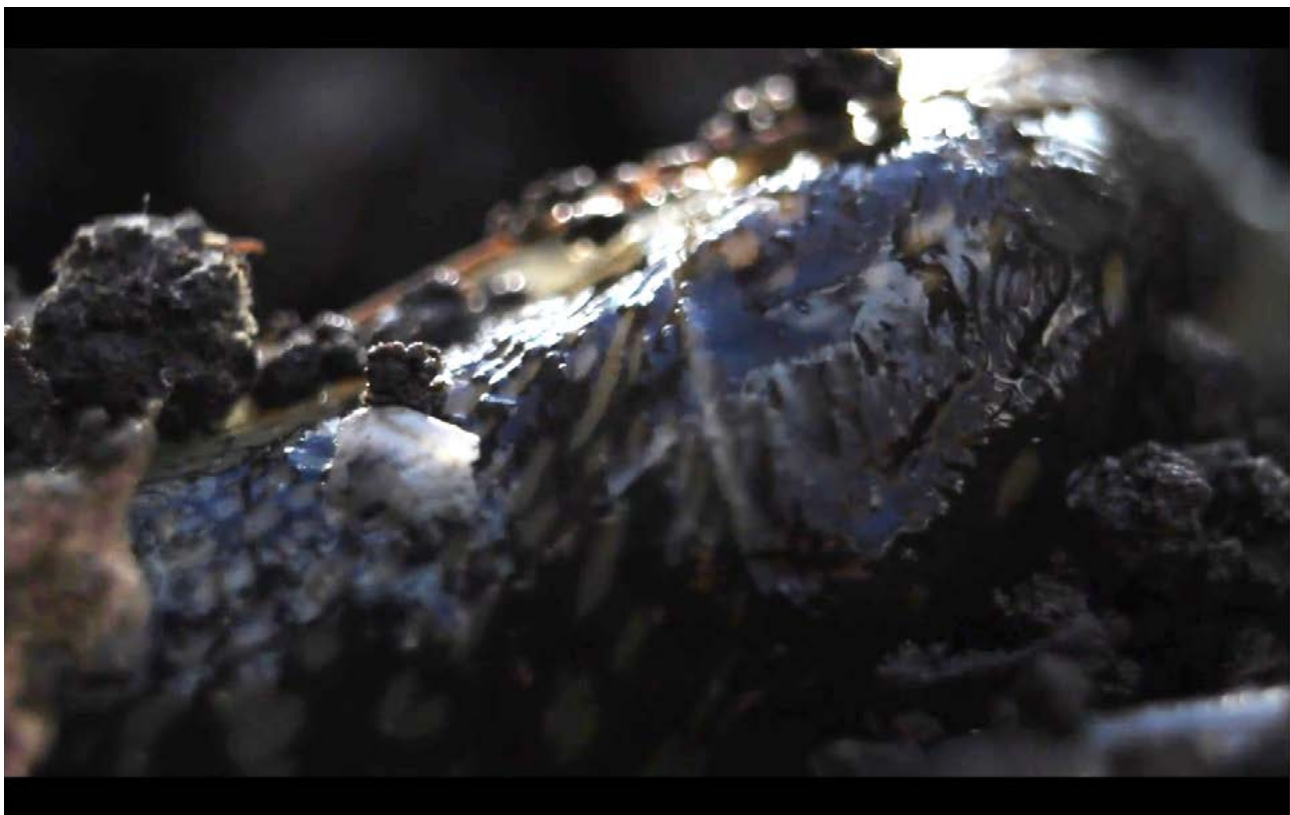
Figura 3. Fotograma del film Tejen (2014). Dirección de Arte: Analía Almada

y las emociones que esto despierta, del mismo modo que lo proponían las Vanitas Vanitatum en los bodegones del siglo XVII: recordar lo vacuo de la existencia.