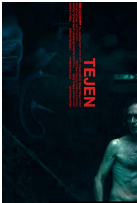
Figura 1. Afiche promocional del film Tejen (2014)