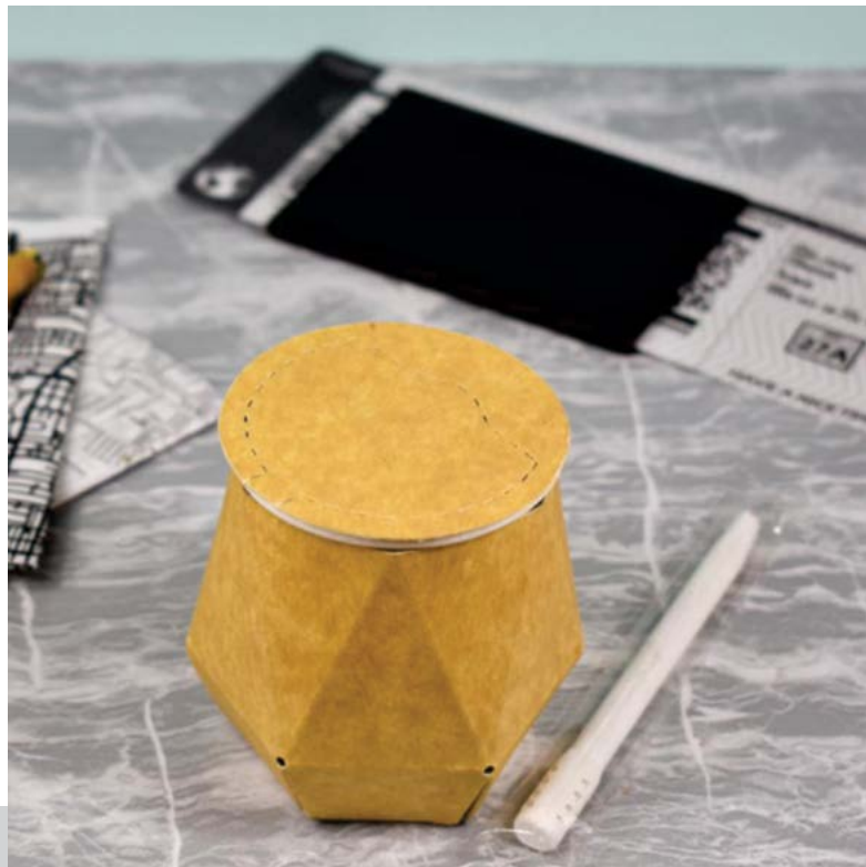
Figura 1. Resultado formal del proyecto

A partir de esta situación, decidimos desarrollar un mate de un solo uso con un enfoque sustentable. El diseño busca remitir a la tipología del mate con una mirada moderna, que saca al usuario del consumo de un vaso descartable para introducirlo tanto en una innovación de mercado como en una vida más ecológica. Esto demuestra la utilidad de los estudios de diseño y, principalmente, de diseño industrial, ya que pueden incrementar la calidad en distintos aspectos de un producto e influir positivamente no solo en el usuario directo, sino también en las generaciones venideras.