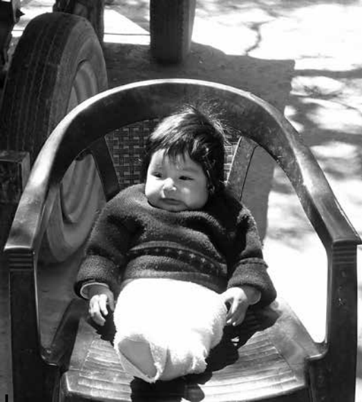
Figura 2 – Niño envuelto («fajado») Santa Rosa, Molinos 2011.

Respecto al transporte y sostén del niño pequeño, guailir o acocochar son términos que hacen referencia a la manera en la que son transportados tradicionalmente las guaguas . Guailir 9 es una palabra usada por las mujeres ancianas, a diferencia de acocochar que es utilizado por las más jóvenes. Consiste en llevar a los niños sobre la espalda dentro de un rebozo (textil confeccionado para tal fin) o poncho (prenda de vestir tejida).