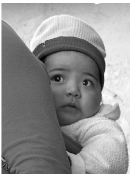
Figura 3 – Guagua dentro de rebozo («a cococho»)

Por acá las gentes de las fincas...yo veo las señoras que vienen a veces de Gualfín, y andan acá en el pueblo así con los nenes (...) dicen que acocochaban a los chicos y los dejaban...ellas iban y trabajaban y hacían las cosas y todo con ellos (GR, 32 años, Molinos, 2010)