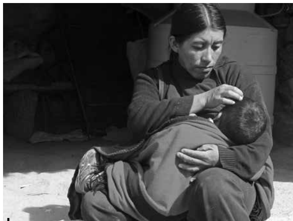
Figura 5 – Mujer amamantando a su guagua

Por último, en lo que concierne a la lactancia y alimentación, la mayoría de las entrevistadas afirma haber amamantado a sus hijos hasta un promedio de dos años, sin embargo, ninguna practicó lactancia materna exclusiva hasta los seis meses, como es indicado por el personal de salud. Con relación a la secuencia de introducción de otra leche y alimentos, las mujeres plantean en principio el umbral de los seis meses como momento prescrito a partir del cual introducen otros alimentos, si bien durante el transcurso de la entrevista y luego de nuevas preguntas del entrevistador, muchas admiten haber incorporado leche envasada y alimentos a partir de los cuatro meses. Al respecto, expresiones frecuentes en sus respuestas son «los médicos te dicen que...» o «después de los seis meses recién