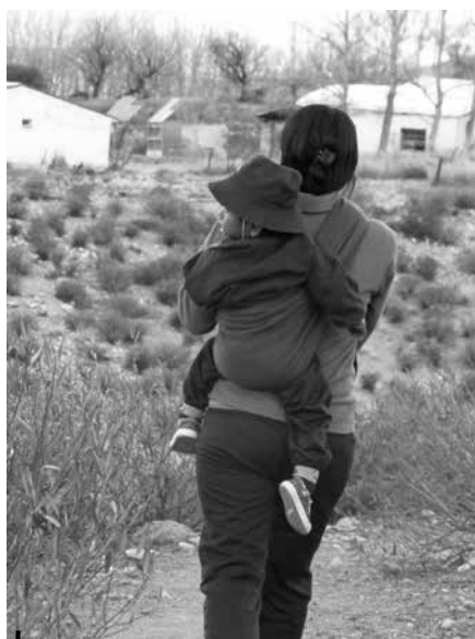
Figura 4 – Mujer cargando a su guagua en rebozo («a cococho»)