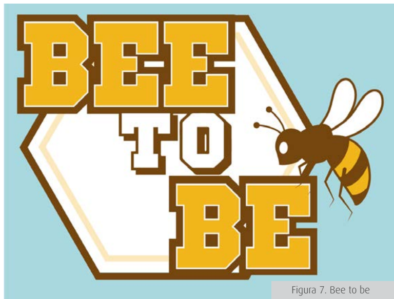
Figura 7. Bee to be

Esta tendencia bee-friendly generará una nueva herramienta para concientizar y renovar el sistema de polinización, para que incremente la biodiversidad y para contribuir con el saneamiento de la polución [Figura 7].