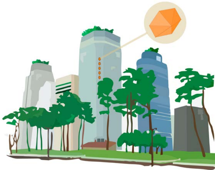
Figura 6. Identificación exterior de edificios en la tendencia BeeFriendly

Esta tendencia bee-friendly generará una nueva herramienta para concientizar y renovar el sistema de polinización, para que incremente la biodiversidad y para contribuir con el saneamiento de la polución [Figura 7].