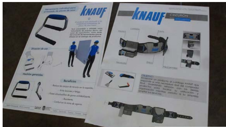
Figura 3. Herramienta individual para el traslado de la placa de yeso. Cinturón para herramientas