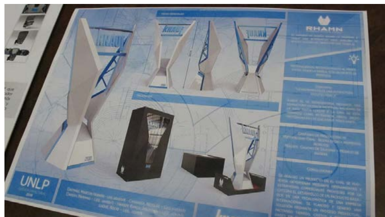
Figura 4. Proyecto Premio Knauf