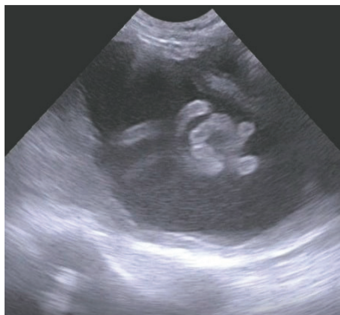
Figura 1. Imagen ultrasonográfica de la glándula prostática conteniendo un adulto de Dioctophyme renale

Al abordar la cavidad abdominal se observó considerable cantidad de líquido sanguinolento y signos de peritonitis. Se realizó laparotomía exploratoria a partir de la que se extrajeron dos ejemplares libres de D. renale , una hembra de 27 cm de cavidad abdominal y un macho de 15,5 cm sobre la cara parietal del lóbulo medial izquierdo del hígado. Mediante la nefrectomía derecha se extrajeron 7 ejemplares, 5 hembras de 73 cm, 48 cm, 46 cm, 45 cm y 41 cm, y 2 machos de 23 cm y 15 cm