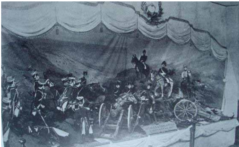
Imagen 2- Escena con figuras de cera, representando la Batalla de Chacabuco. Museo Escolar Sarmiento (Biedma, 1952).

idea que une la historia de un museo con la biografía de su organizador. Pero esta unión revela otro aspecto: la fragilidad de las instituciones argentinas y su carácter de refugio o “corporización” de las buenas intenciones, lecturas e intereses de sus promotores (PODGORNY, 2009).