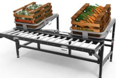
Figura 1. Mesa para llenado de bolsones