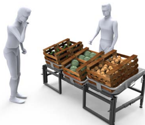
Figura 3. Mesa para exhibir y comercializar productos