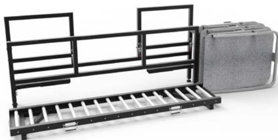
Figura 4. Producto plegado