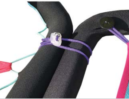
Figura 1. Vinculación entre las piezas