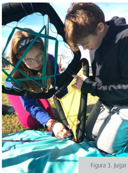
Figura 3. Jugar en familia