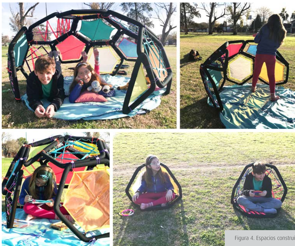
Figura 4. Espacios construidos