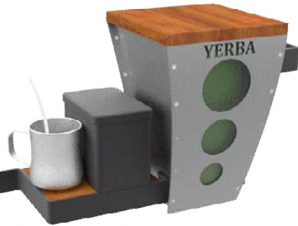
Figura 1. Perspectiva superior