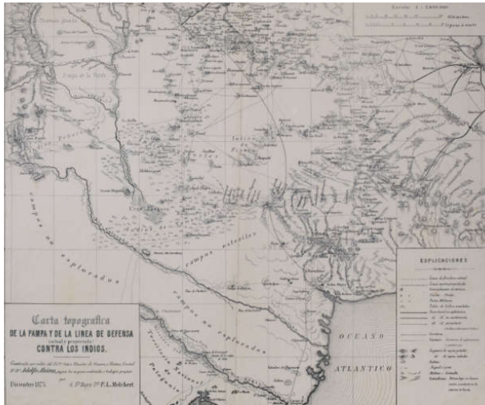
Buenos Aires: Litografía de Alberto Larsch, diciembre de 1875.

En el plano del territorio nacional de 1875 observamos, casi como si fuera una onda expansiva, las líneas oscuras que marcan el avance del ferrocarril en el vértice superior derecho, pujando hacia el límite del territorio que en ese momento era el Río Colorado.