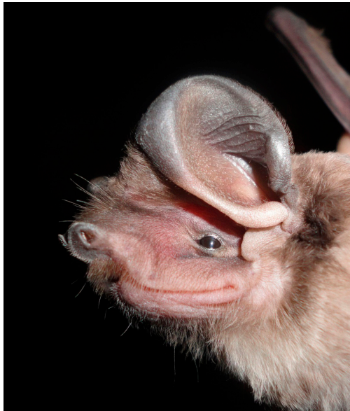
Fig 1. Detalle de la cabeza de un ejemplar macho de Eumops dabbenei capturado en Parque Nacional Copo, Provincia de Santiago del Estero, Argentina.

provincia de Chaco, por Barquez et al. (1999). En Argentina, los registros de la especie son escasos; ha sido citada en Chaco, Salta, Santa Fe, Santiago del Estero y Entre Ríos (De Souza et al., 2008; Barquez y Díaz, 2009). La especie habita en las eco-regiones del Chaco Húmedo, Chaco Seco, Espinal y, marginalmente, Yungas (Barquez, 2006).