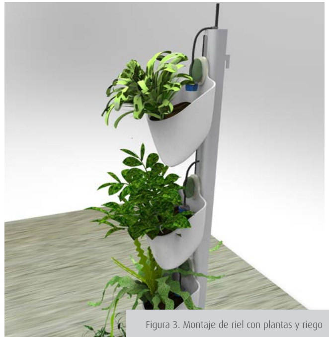
Figura 3. Montaje de riel con plantas y riego