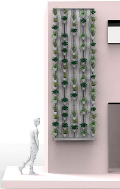
Figura 1. Ámbito/escala. Tres paneles en vertical

El diseño de todo el sistema se define como abierto y articulado, ya que permite un fácil acceso a todos sus componentes de manera individual [Figura 5]. Las plantaciones sin suelo y verticales son una realidad en aumento en un contexto de creciente urbanización y el diseño industrial tiene un papel fundamental para la creación de objetos en este sentido.