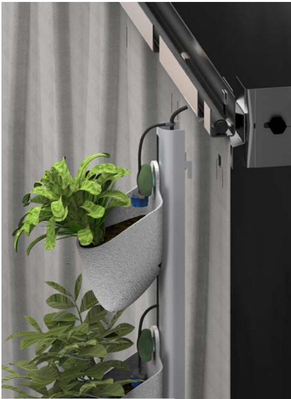
Figura 4. Fijación de riel (con plantas y riego) a panel