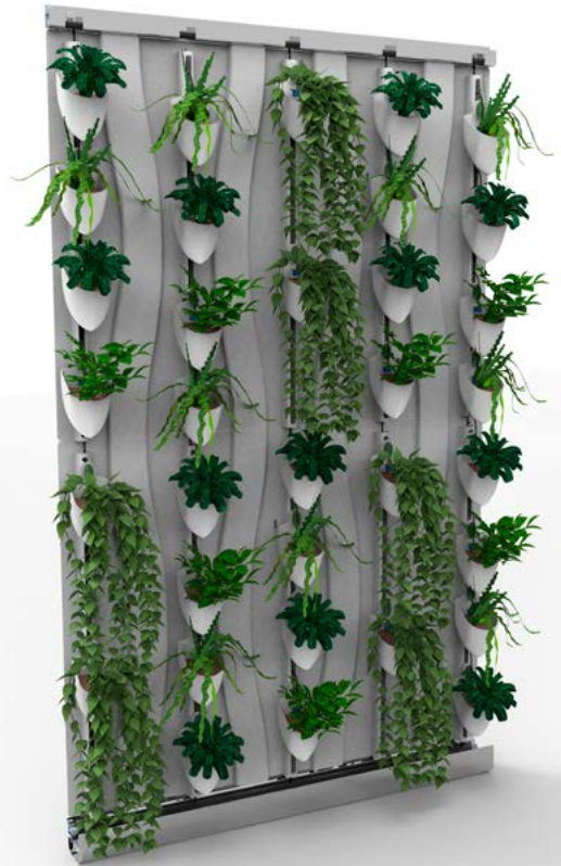
Figura 5. Jardín instalado con todos sus componentes (dos paneles en vertical)