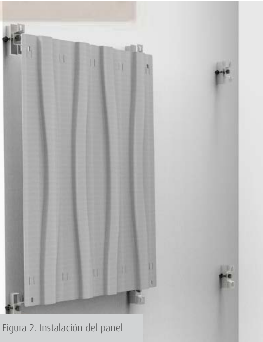
Figura 2. Instalación del panel