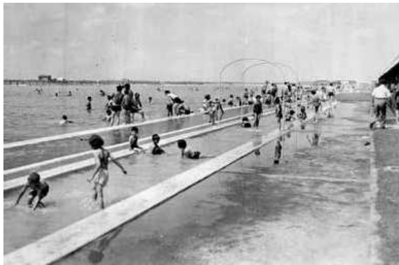
Figura 5: Vista de una de las piletas de Ezeiza durante el verano, sin fecha.