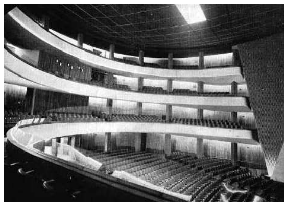
Figura 3: Vista de la sala desde las plateas altas.