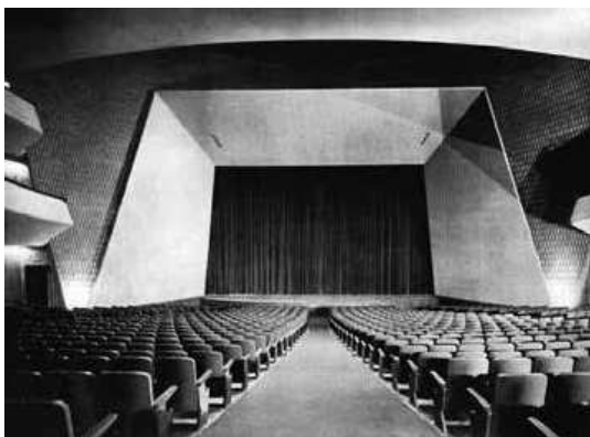
Figura 2: Vista del escenario del Teatro Coliseo desde la entrada.