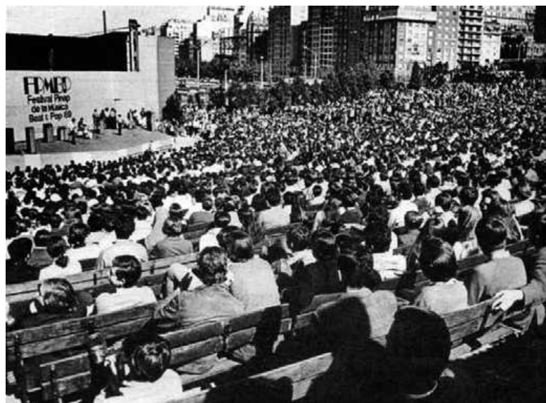
Figura 10 (der.): El Anfiteatro durante la realización del "Festival Pinap de la Música Beat y Pop", 1969.