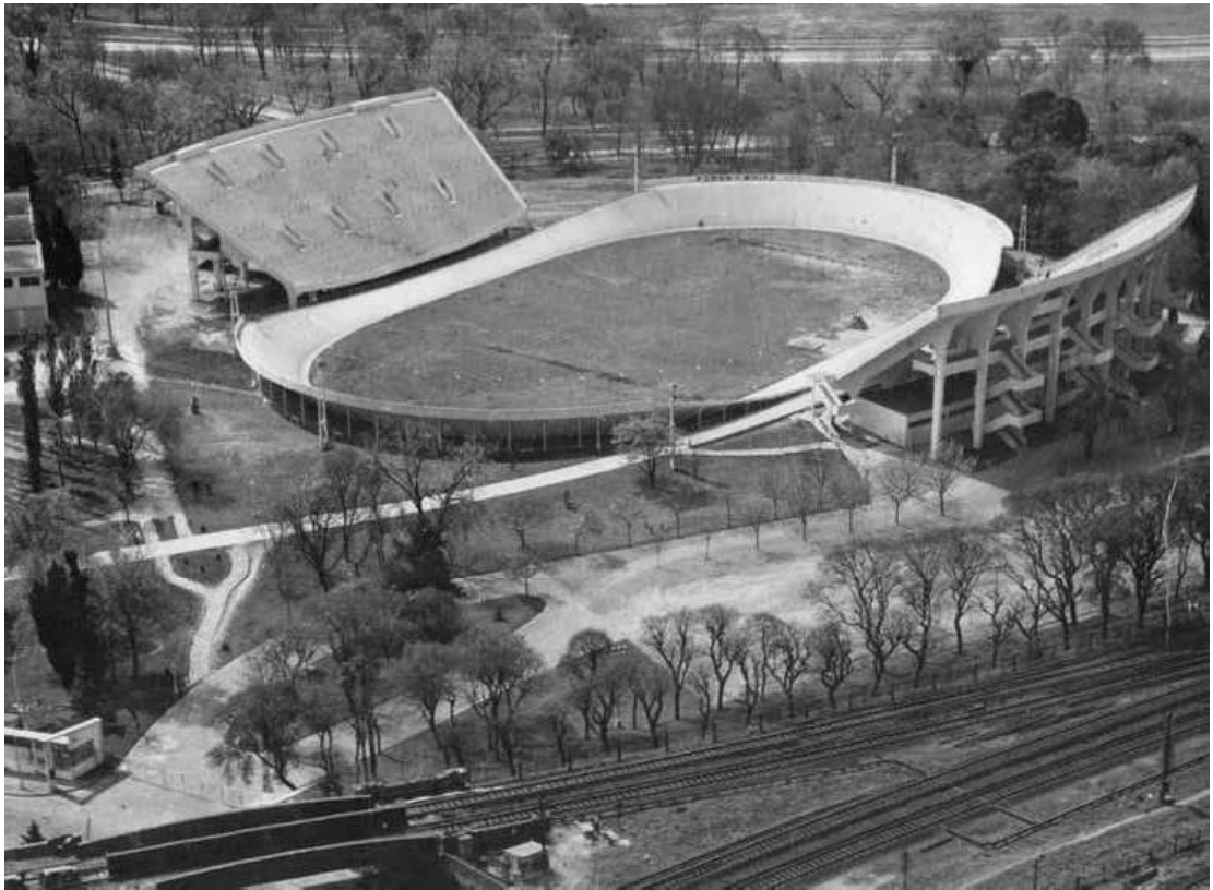
Figura 7 (arriba): Vista aérea del velódromo de Palermo y el Parque 3 de febrero, 19 de noviembre de 1958.