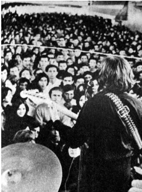
Figura 6: Las piletas de Ezeiza durante el "Festival de la Música Joven".