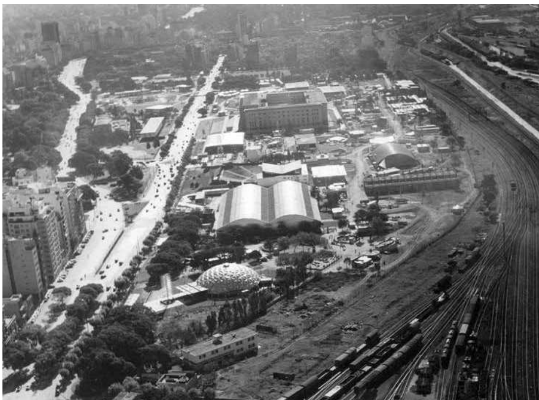
Figura 9 (arriba): Feria Nacional del Sesquicentenario, 1961 (En el centro de la exposición puede verse el anfiteatro).