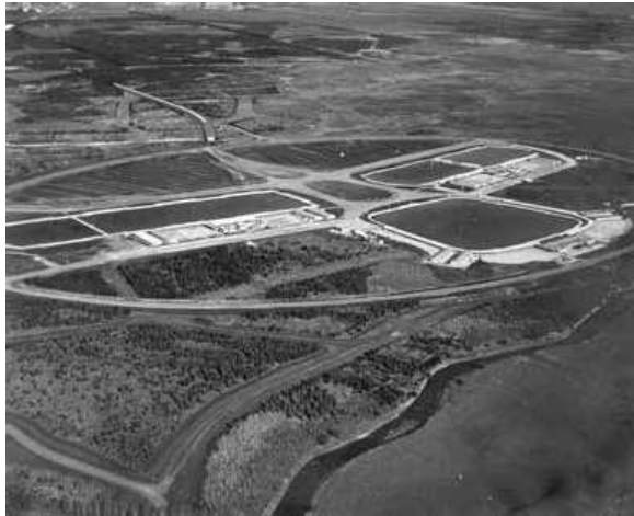
Figura 4: Vista aérea del balneario popular de Ezeiza, sin fecha.