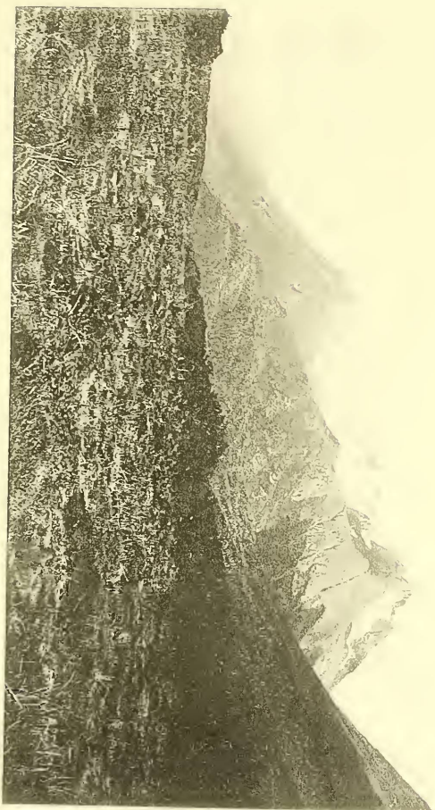
TALLERES DEL MUSEO

Tourbières dans la vallée supérieure du Rio Olivaia