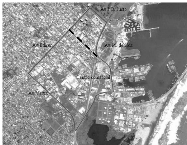
Figura 1: Imagen satelital de la zona del Puerto de Mar del Plata con su Centro Comercial y barrios aledaños. Con líneas llenas se sectoriza la zona del SGD que se evalúa y con trazo de líneas punteadas la calle 12 de Octubre donde se encuentra su Cordón Comercial.

La metodología empleada en el SGD propuesto, se corresponde con los lineamientos mínimos del PD GIRSU-MGP reconocidos internacionalmente por su sustentabilidad ambiental y aceptación social, pero a diferencia de éste, se aplica en un sector del barrio Puerto de la ciudad de Mar del Plata, limitado por las arterias Av. Vértiz, Av. Edison, Av. J.B. Justo, y Av. M. de Hoz, e incluye el Centro Comercial del Puerto. Este sector de aplicación limita al sureste con la Reserva Natural Puerto Mar del Plata, al este con la playa de estacionamiento de camiones Puerto y al noreste con el campo de juego del Mar del Plata Golf Club, presentando multiplicidad de usos de suelo, por lo que el SGD incluye estrategias en correspondencia a cada uno de los residuos que allí se generan. La Figura 1 ilustra sobre la zona de aplicación descripta.