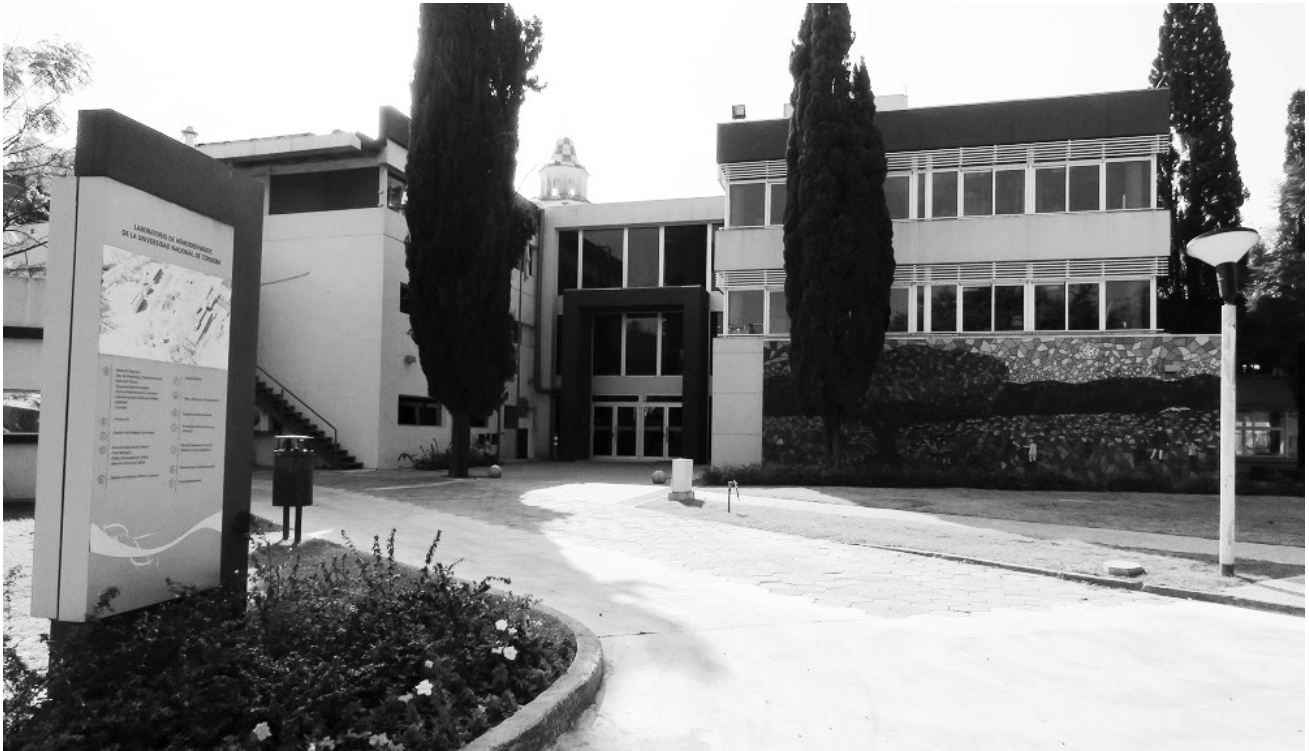
Figura 1. El Laboratorio de Hemoderivados de la UNC, ubicado en la Ciudad Universitaria de Córdoba.

través del desarrollo de un proyecto innovador en el contexto de una universidad pública” (Massa, 2013: 9), con un objetivo social y sin fines de lucro.