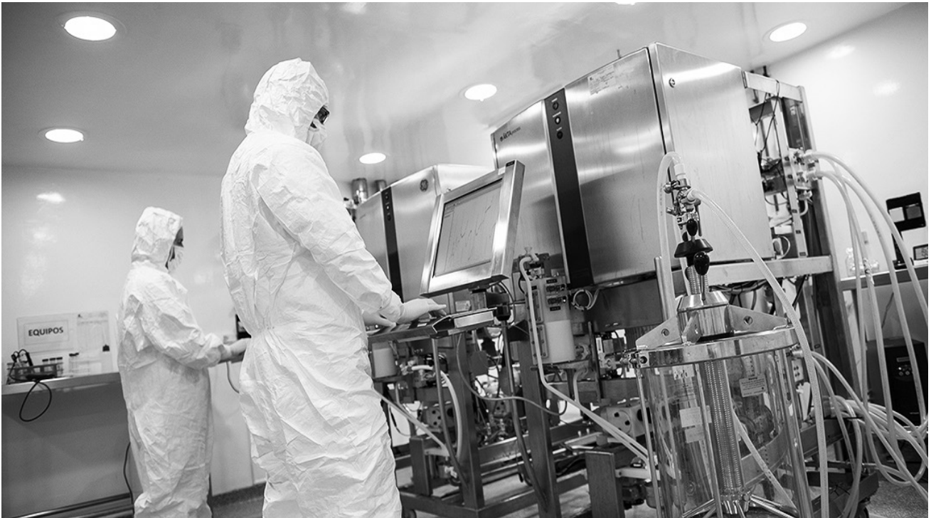
Figura 2. Personal técnico del LHUNC trabajando con equipos de última generación y bajo estrictas normas de higiene y calidad (Fuente LHUNC).

la materia prima en los bancos de sangre o centros de hemoterapia, la producción de los hemoderivados o proteínas plasmáticas y su distribución a los centros de salud.