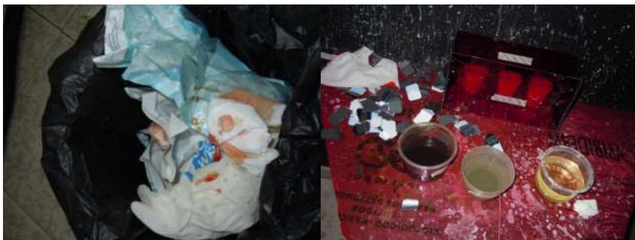
Fotografías 8 y 9. Aquí se demuestra que sí existe generación de RPBI, de acuerdo a lo contestado anteriormente por el personal de limpieza.