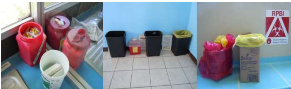
Fotografías 5, 6 y 7. Aquí se muestra el tipo y condiciones de los recipientes y contenedores que se usan para los residuos.

to practico, dentro de las medidas de bioseguridad fue solo el uso de guantes y botas de hule, el 100% desconoce las regulaciones de SEMARNAT para el manejo de los RPBI, sin embargo el 100% están dispuestos a colaborar en la implementación de medidas para el manejo de los RPBI (Gráficas siguientes).