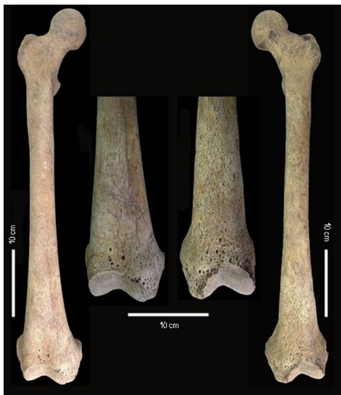
Figura 4. Fotografías de los fémures derecho e izquierdo hallados de forma aislada en el núcleo de inhumación y de las reacciones periósticas en sus tercios distales.

Más allá de estas modalidades de entierro registradas en el núcleo de inhumación, en la cima del montículo se detectó un fogón conteniendo restos óseos termoalterados. Hasta el momento fueron analizados de forma preliminar 493 fragmentos. El 82,4% de este conjunto no pudo ser determinado taxonómicamente, dado que son especímenes menores a 2 cm y/o sin rasgos diagnósticos para su identificación. El 17,6% (NISP = 87) restante corresponde a fragmentos de huesos humanos pertenecientes al menos a un individuo adulto. Principalmente son especímenes del cráneo (77%; NISP = 67) y en menor porcentaje de mandíbula, tibia, fémur, peroné y dientes (23%; NISP = 20). De este conjunto de huesos humanos, el 75% (NISP = 65) presentaba signos de termoalteración, predominando los fragmentos de color negro (77%) y en menor proporción los de color gris y blanco (23%). Estos datos sugieren que los elementos óseos estuvieron expuestos a distintas temperaturas, produciendo su carbonización y calcinación, respectivamente. En todos los casos, los restos presentaban toda la superficie afectada por el fuego. Asimismo, en el 37% de este conjunto se observó ocre sobre la superficie cortical, el cual habría sido aplicado con posterioridad a la termoalteración. Igualmente esto deberá ser corroborado con la profundización del análisis de este registro.