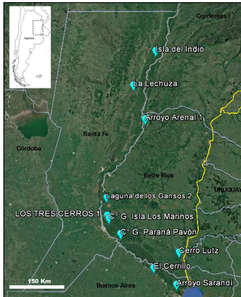
Figura 1. Ubicación de LTC1 y de sitios arqueológicos mencionados en este trabajo (investigados por distintos autores) y de otros excavados por el equipo de investigación.

de entierro. Sus ocupantes fueron grupos cazadores, recolectores, pescadores y horticultores, asignados a la entidad arqueológica Goya-Malabrigo (Politis y Bonomo 2012).