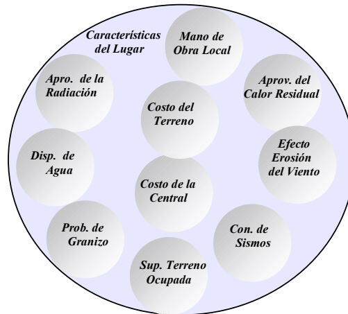
Figura 1. Esquema del Conjunto Difuso de Características del Lugar.

Es por ello que se decidió trabajar con las variables involucradas en forma de conjuntos difusos, ya que el grado de pertenencia que asigne cada subconjunto a los elementos del conjunto, involucra cierto grado de incertidumbre, propias de la variable. En este trabajo, primeramente se definió un conjunto difuso denominado Características del Lugar , este se dividió en diez subconjuntos que citan en el párrafo precedente, y tal como se observa en la figura 1.