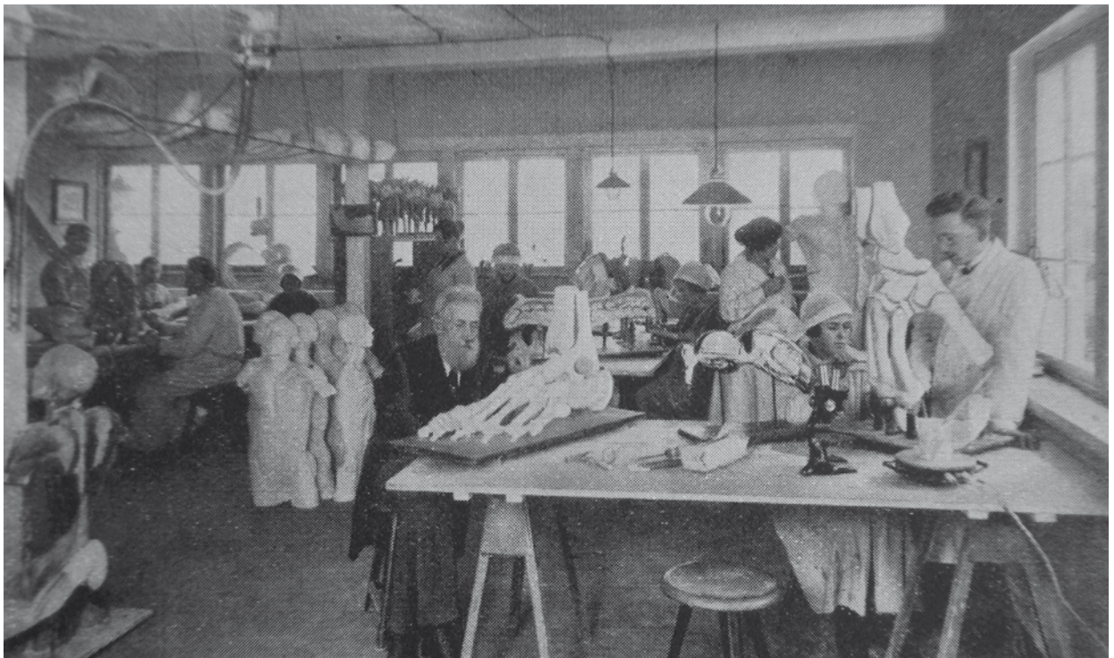
▲ Talleres de producción de piezas anatómicas y colecciones biológicas de la empresa alemana Koehler & Volckmar, ca.1930. Koehler & Volckmar, Leipzig, Stuttgart, Berlin. Leipzig: Gedruckt in der Offizin Haag-Drugulin, s/d. Biblioteca Pública de la Universidad Nacional de La Plata.