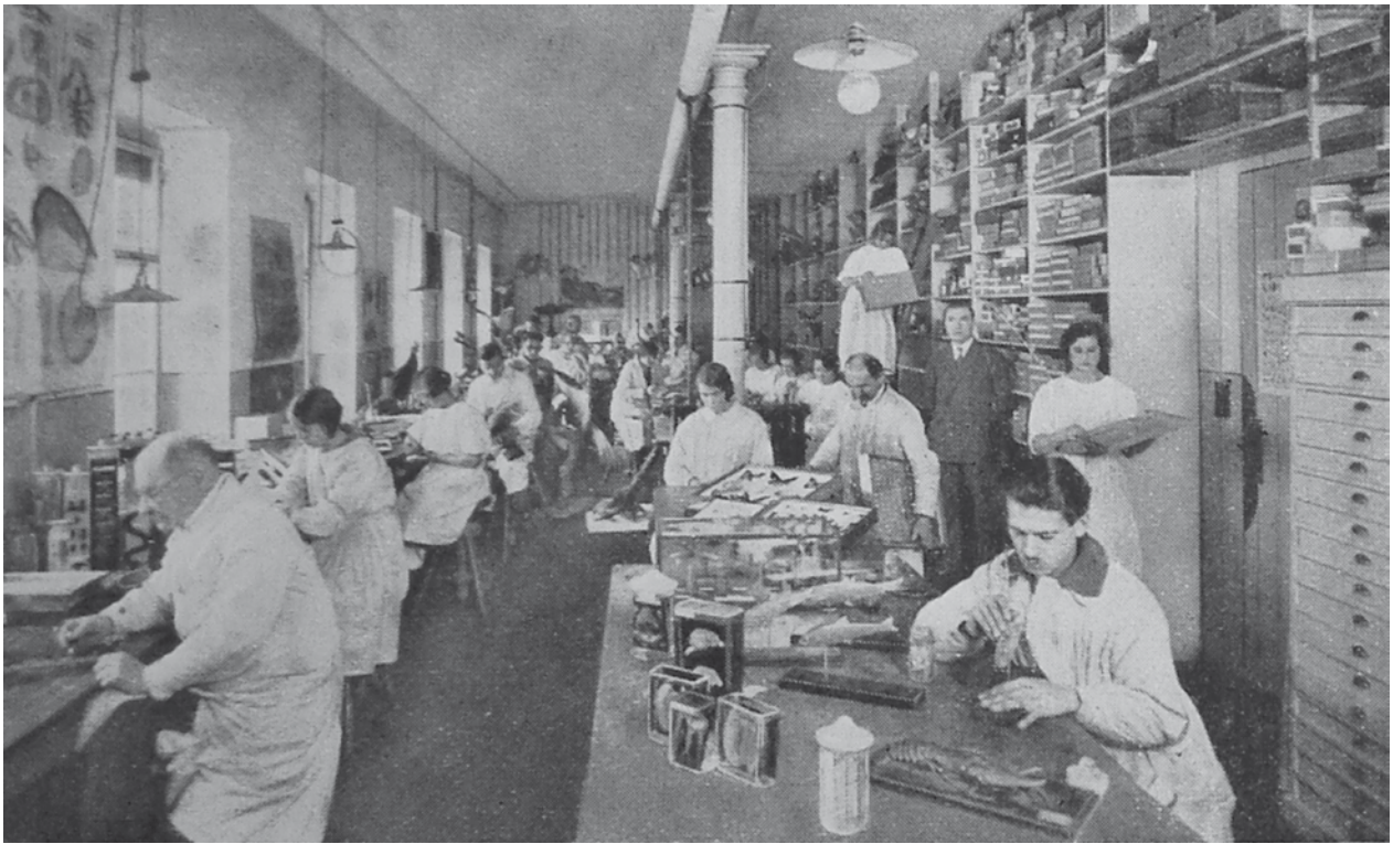
▲ Referencia Taller de producción de piezas anatómicas de la empresa alemana Koehler & Volckmar. Koehler & Volckmar, Leipzig, Stuttgart, Berlin. Leipzig: Haag-Drugulin, s/d. Biblioteca Pública de la Universidad Nacional de La Plata.

los alumnos asimilaran los procedimientos en relación con las habilidades para la manipulación de especímenes e instrumentos de trabajo y la "correcta" interpretación de los resultados. De esta manera, la transformación del Museo de La Plata en museo universitario va creando un acervo patrimonial paralelo, que se va descartando o combinando con otras colecciones para la enseñanza, y que termina dando forma a "un museo" de la cultura científica, que nadie visita ni registra pero que existe y se acumula.