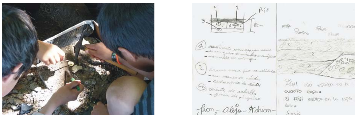
Figura 5. Izquierda: búsqueda de “fósiles” en distintos niveles de terreno. Derecha: libreta de campo y construcción de un perfil geológico con sus fósiles.

(piquetas, brújula, libreta de campo, yeso, vendas, pinceles, etc). Se buscan restos “fósiles” en diferentes niveles de suelo, se utilizan los principios de la tafonomía para establecer tiempo y factores que actuaron durante su enterramiento.