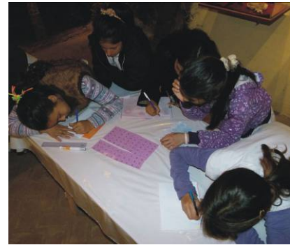
Figura 7. Taller Itinerante en el Museo Paleontológico Municipal de San Pedro "Fray Manuel de Torres", San Pedro.

Además de las actividades realizadas en las diferentes instituciones mencionadas, el equipo de trabajo del proyecto realiza reuniones quincenales para planificación y diseño de actividades, evaluación del desarrollo del proyecto y capacitación de los nuevos talleristas.