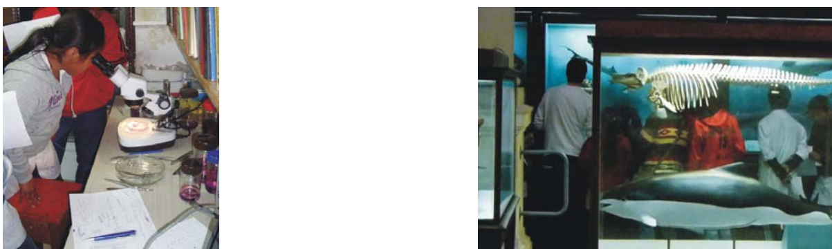
Figura 4. Visita al Museo de La Plata y sus laboratorios.

4. Conservación del patrimonio paleontológico e importancia de los museos: se enfatiza sobre la importancia de la conservación del patrimonio paleontológico en el marco de la Ley Nacional 25743/03 de conservación del patrimonio arqueológico y paleontológico. Se realiza una visita al Museo de La Plata, durante la cual se recorren las salas buscando respuestas a consignas que fueron brindadas previamente y se visitan los laboratorios de preparación de fósiles, los laboratorios de algunos investigadores y la colección de vertebrados fósiles. El fin de esta actividad es poner en discusión el rol de los museos en la preservación y exhibición de las piezas fósiles, en la investigación y divulgación.