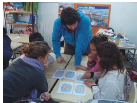
Figura 2. Izquierda: elaboración de afiches sobre tiempo absoluto y relativo. Derecha: reconstrucción de la deriva continental.