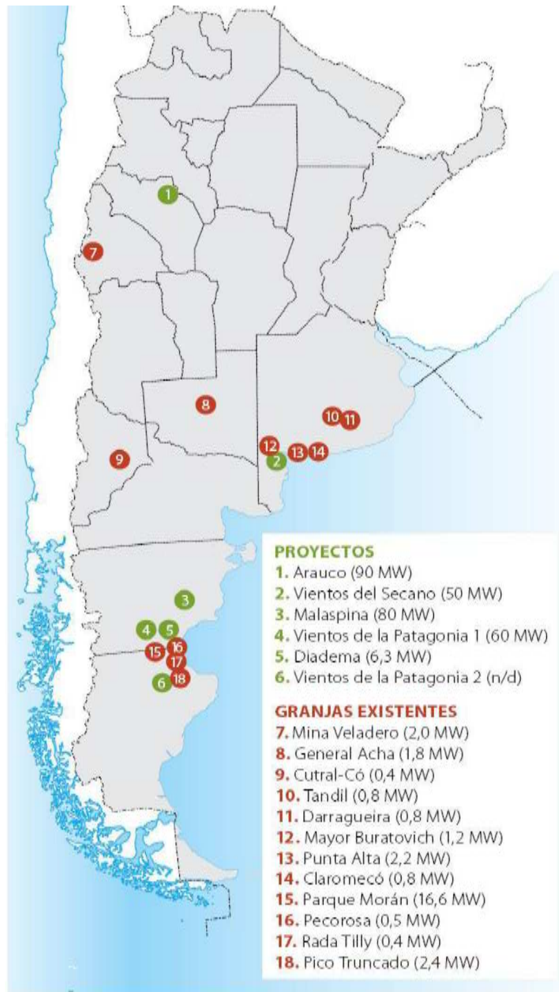
Figura I: Distribución geográfica de los parques eólicos argentinos y proyectos de futuras granjas.