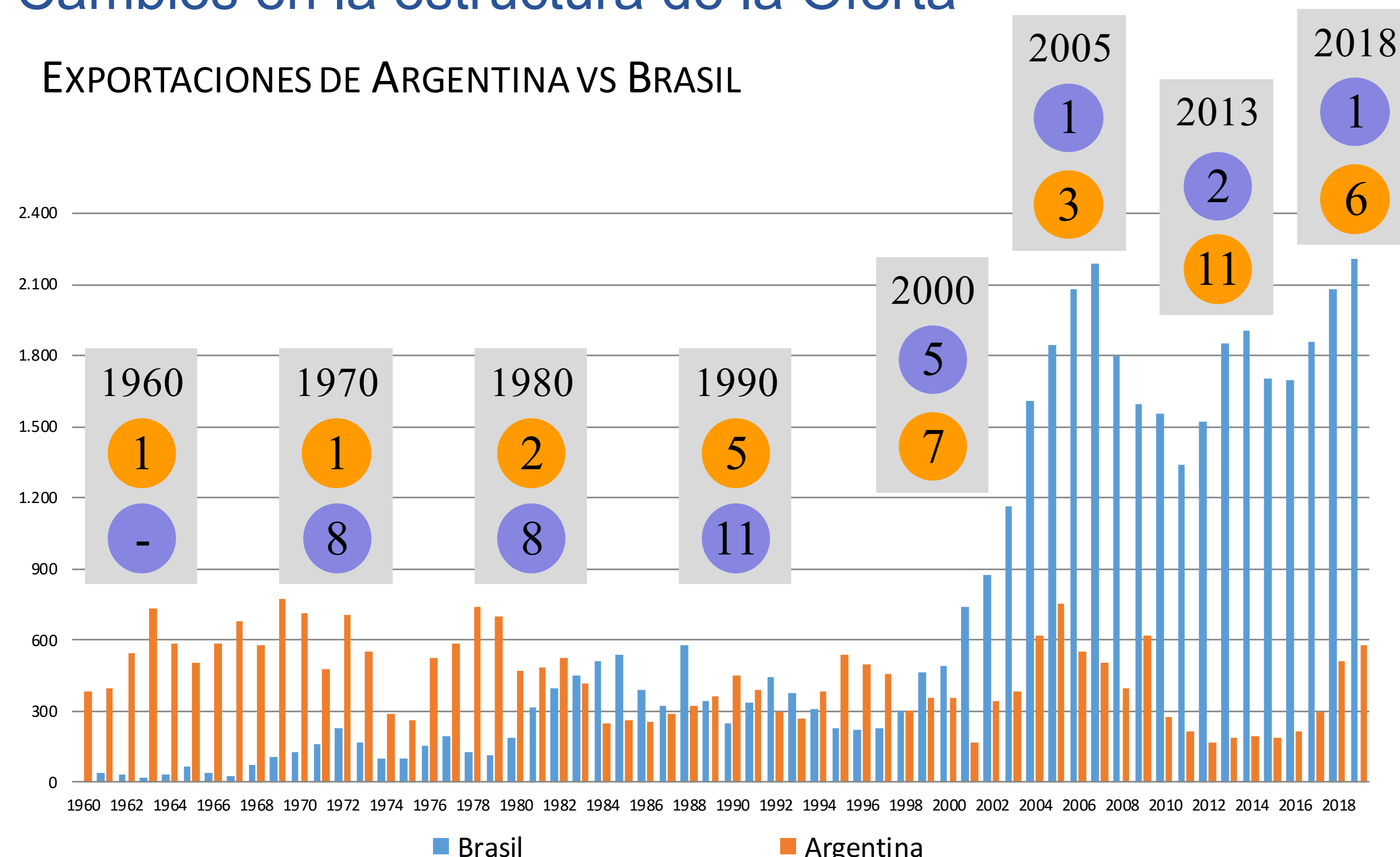
EXPORTACIONES DE ARGENTINA VS BRASIL