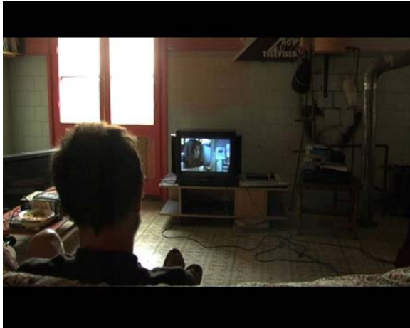
Imagen N° 1, fotograma del documental Can Masdeu.

“Can Masdeu”. En esta escena, se alcanza la síntesis entre el presente y el pasado, a través de las reflexiones de los interlocutores al observar el material editado tres años atrás (video-elicitación). De esta forma, la puesta en escena se acerca a la definición expresada por J. Ruby “La antropología se define actualmente [...] como una ciencia que puede acoger la inherente relación reflexiva entre el productor, el proceso y el producto. Y J. Grau añade “... y a éstos con la audiencia” (Grau, 2001: 58).