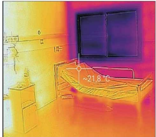
Figura 2: Termografía de una habitación de internación