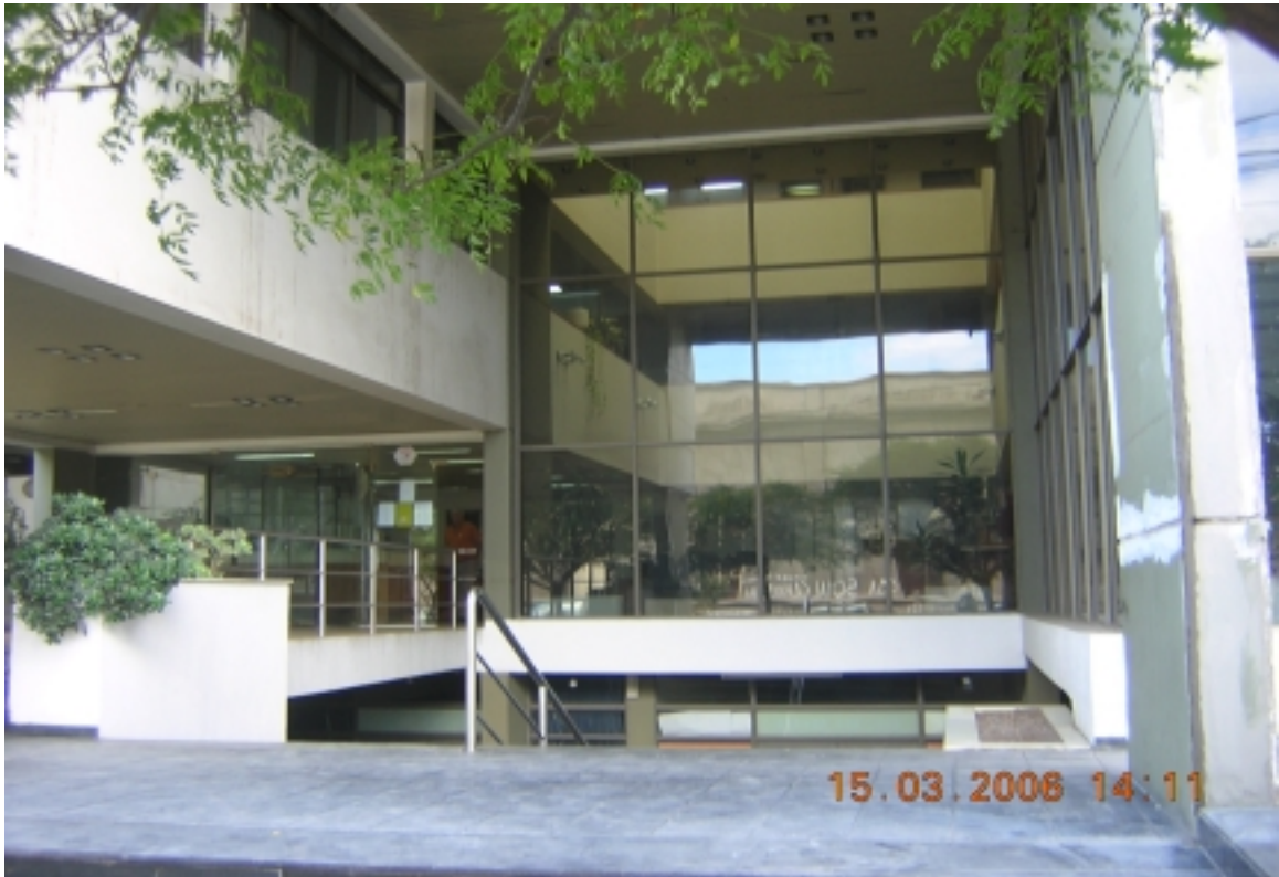
Rodeo del Alto : sobre la ruta 20, ahora funciona el Club de Suboficiales del ejército.