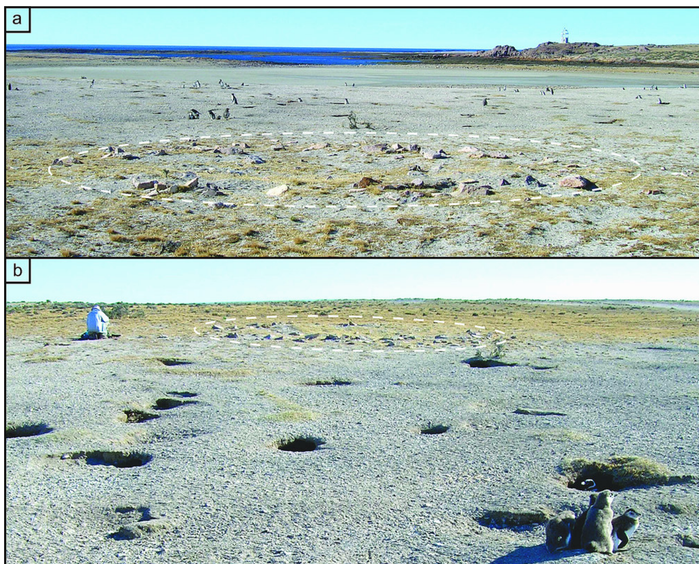
Figura 2. Sitio Shag (indicado por un óvalo) y colonia de pingüinos: a) vista N-S, (b) vista S-N.

fracción orgánica (colágeno), se realizó en el Laboratorio de Paleoecología Humana del Museo de Historia Natural de San Rafael, y las mediciones se efectuaron en la Stable Isotopes Facility de la Universidad de Wyoming. Se analizaron diferentes variables tafonómicas para evaluar las condiciones de preservación de los restos óseos: presencia de dióxido de manganeso y carbonato cálcico, marcas de raíces, roedores y carnívoros, modificaciones antrópicas y estadios de meteorización (Buikstra y Ubelaker 1994).