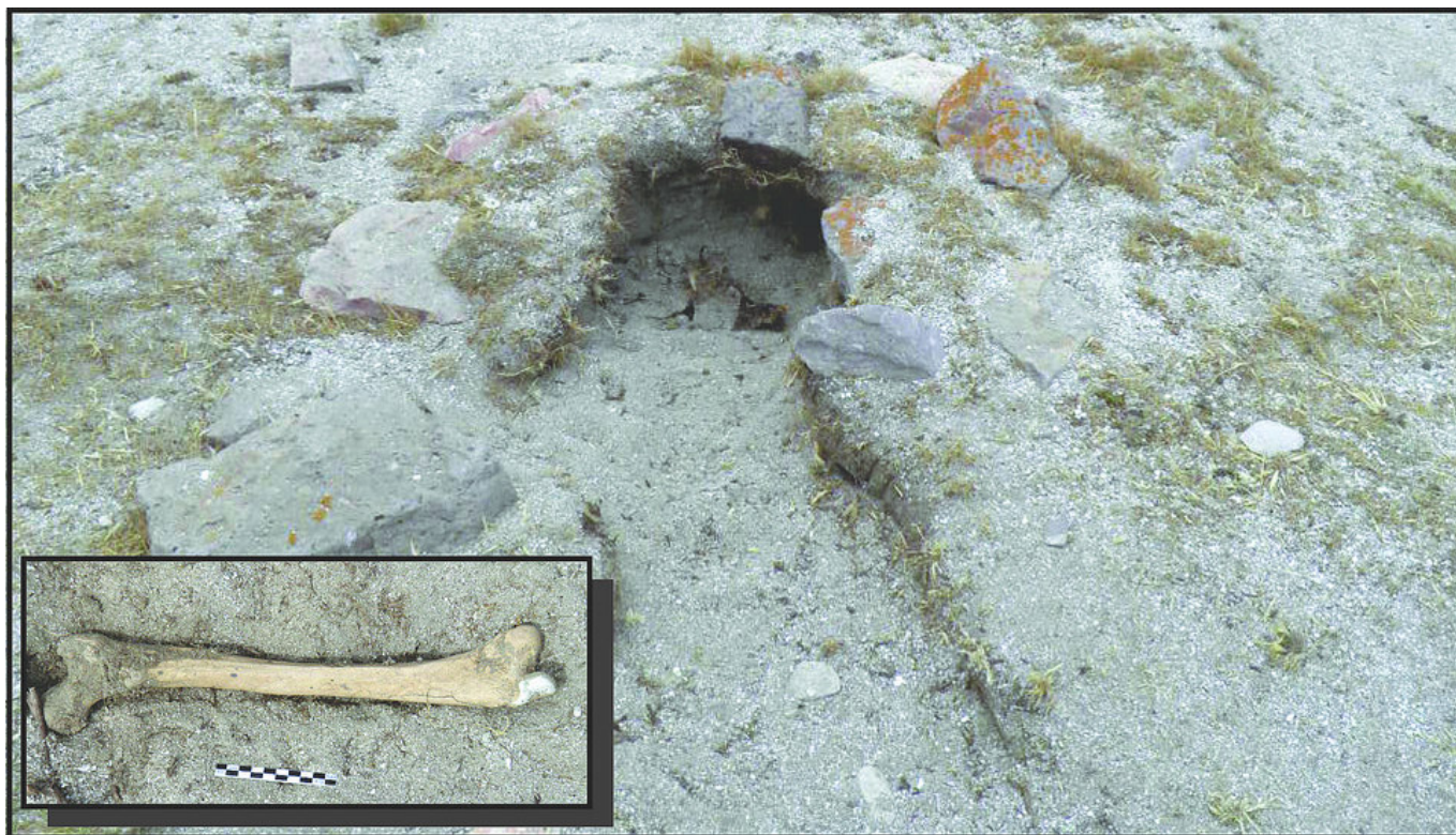
Figura 3. Fotografía del pozo de nidificación de pingüinos de Magallanes en el entierro Shag. En el recuadro se observa un fémur humano expuesto en superficie por la acción de pingüinos.

langes y un fémur izquierdo (fig. 3). Del análisis de estos restos óseos se infiere un número mínimo de un individuo.