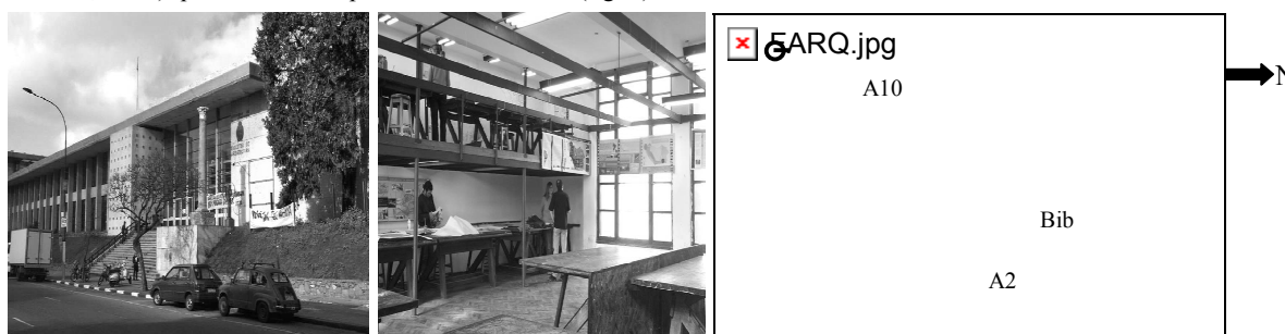
Figura 1: Vistas de la fachada Este y del aula 2 y planta del edificio con la ubicación de los locales estudiados.

El edificio central de la Facultad de Arquitectura, UDELAR, ubicado en Montevideo, fue construido hacia 1945 y ampliado hacia 1980. Cuenta con un área aproximada de 11500 m 2 distribuidos en 3 sectores (hall y salón de actos, biblioteca y oficinas, aulas) que rodean un espacio exterior central (fig. 1).