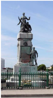
El “Memorial 1916”, emplazado en Limerick.

declararon la independencia de Irlanda y una república. También están escritos los nombres de los 16 hombres que fueron ejecutados en mayo, luego del levantamiento, y en los paneles laterales figuran los 65 hombres que murieron en combate.