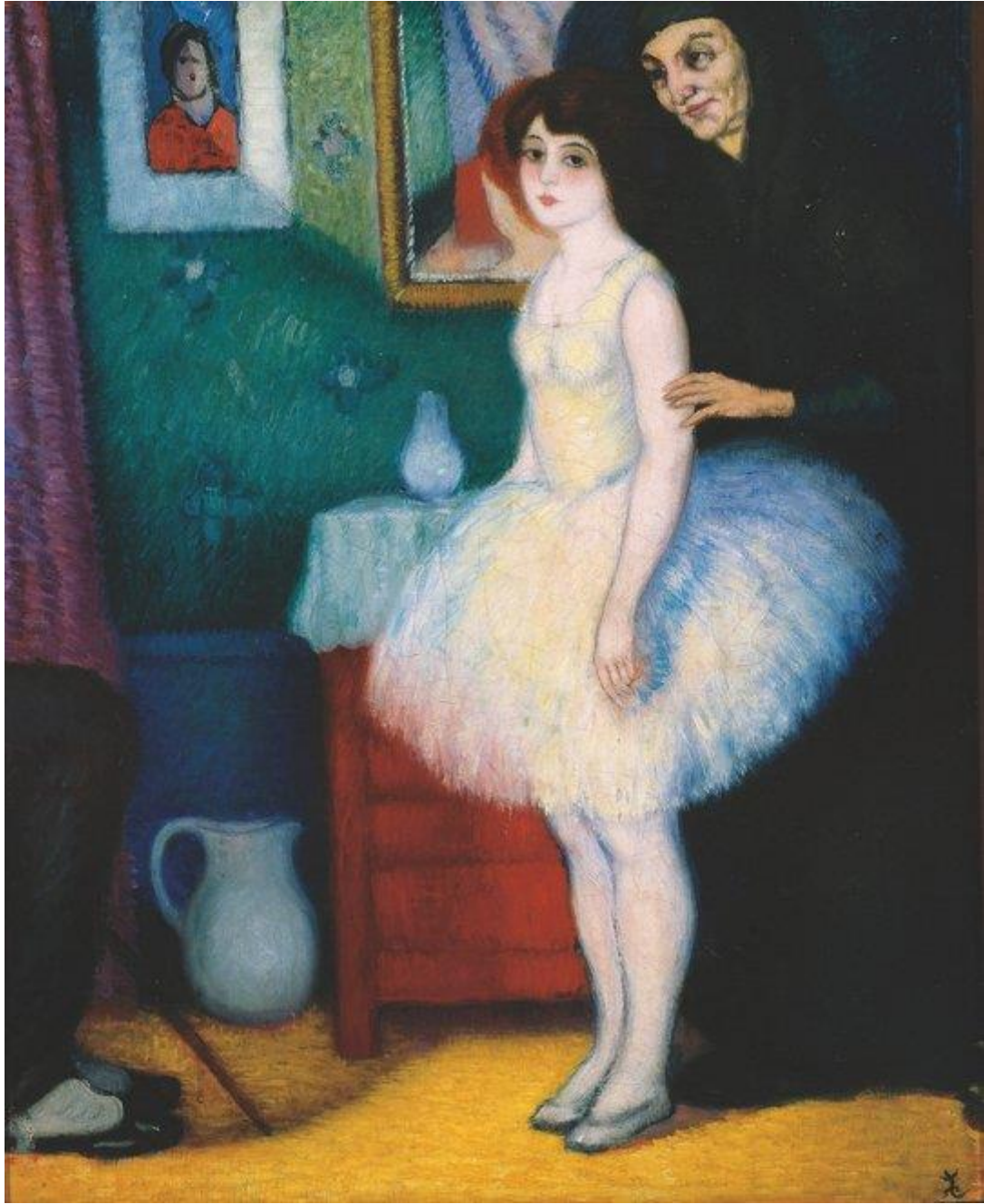
Figura 4. Valentín Thibon de Libian, La presentación (1918). Óleo sobre tela, 76 x 64 cm. Museo Nacional de Bellas Artes