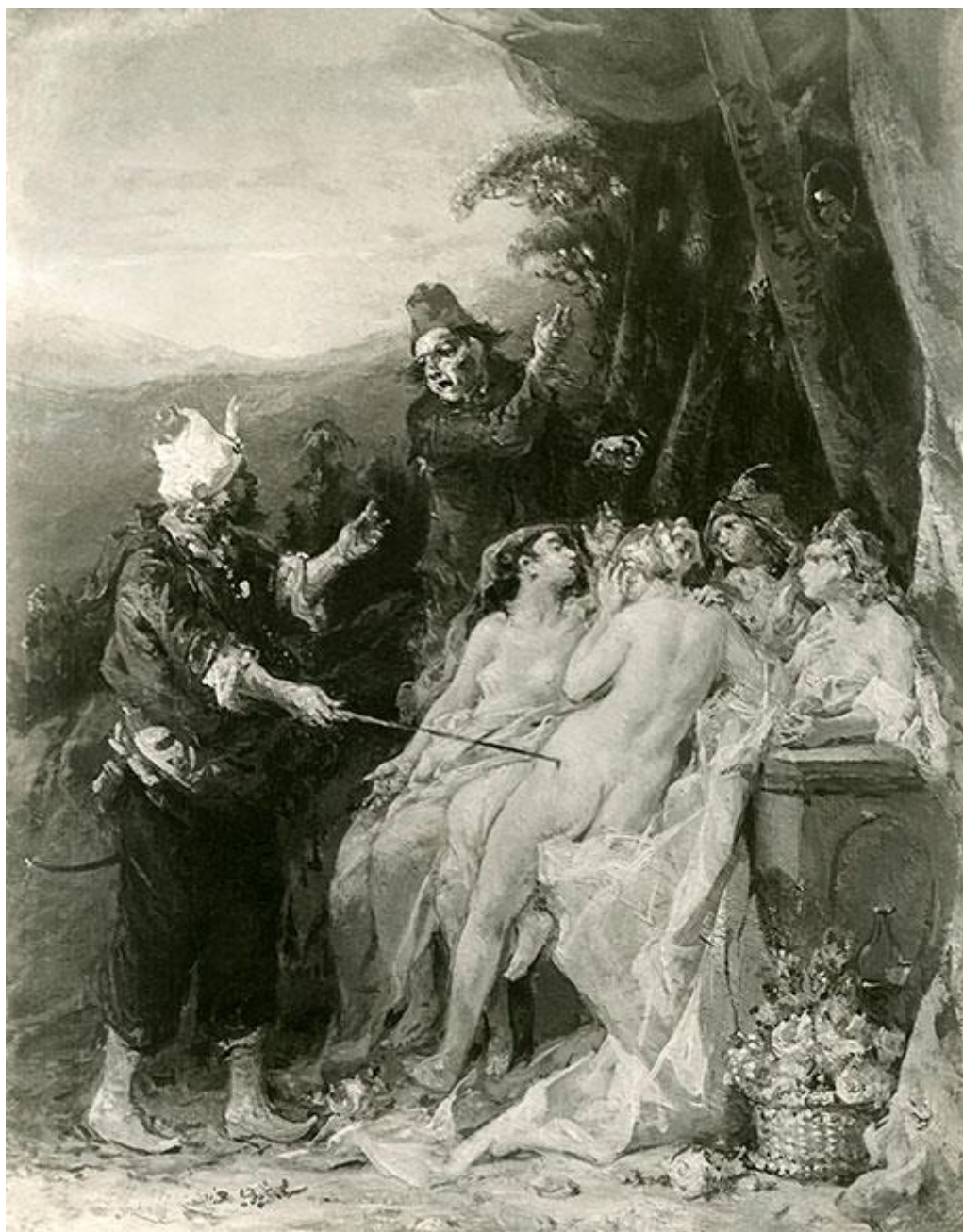
Figura 1. Ignacio Manzoní, Mercado de esclavas (ca. 1881). Óleo sobre tabla, 39 x 30 cm. Museo Nacional de Bellas Artes