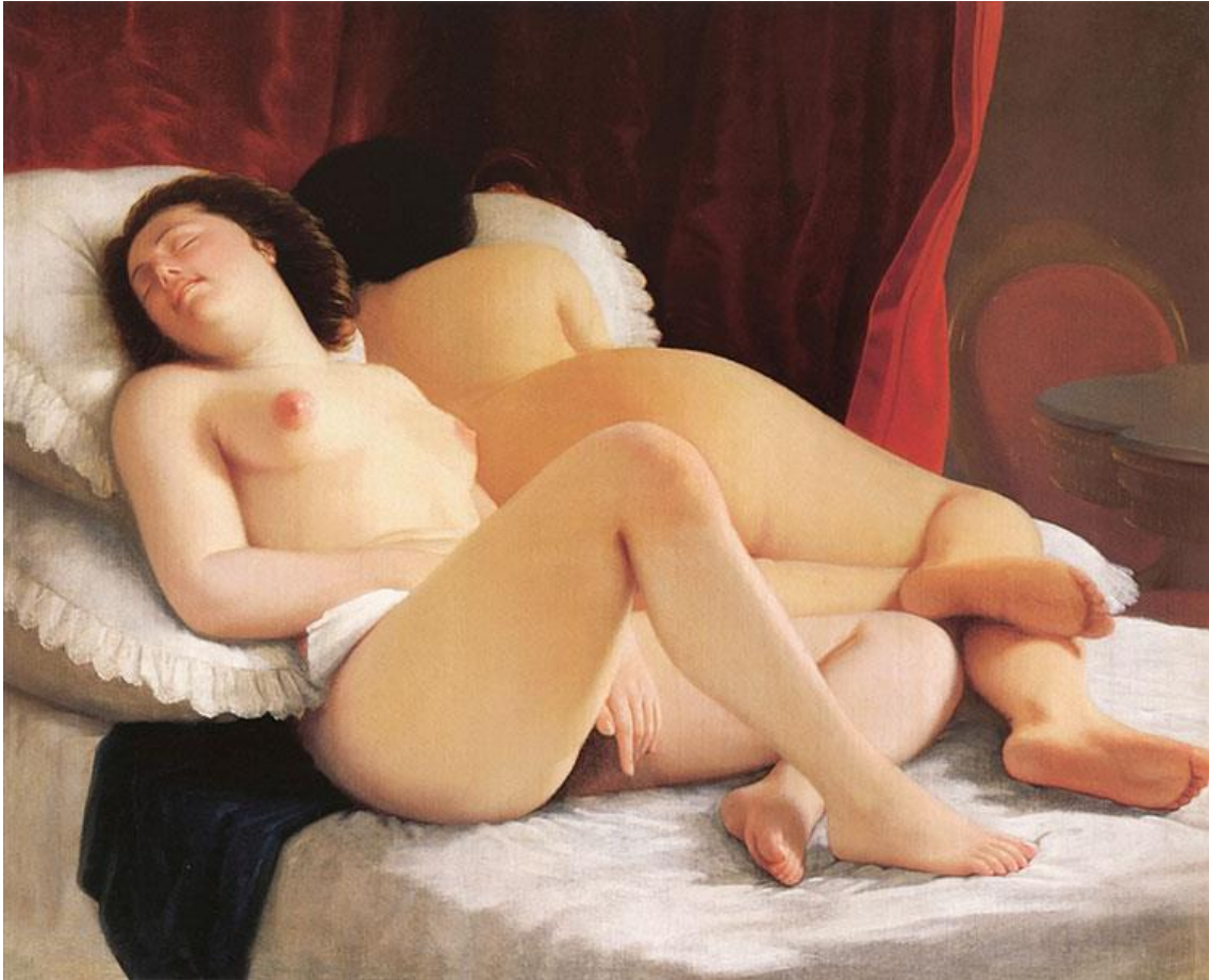
Figura 2. Prilidiano Pueyrredón, La siesta (1865). Óleo sobre tela, 100 x 122,5 cm. Colección privada