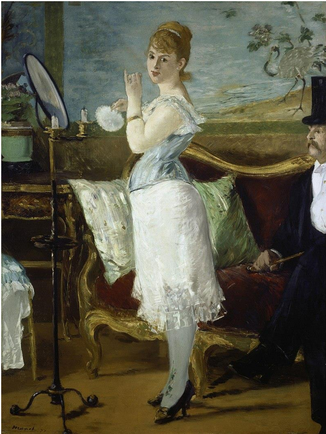
Figura 3. Édouard Manet, Nana (1877). Óleo sobre tela, 154 x 115 cm. Kunsthalle, Hamburgo