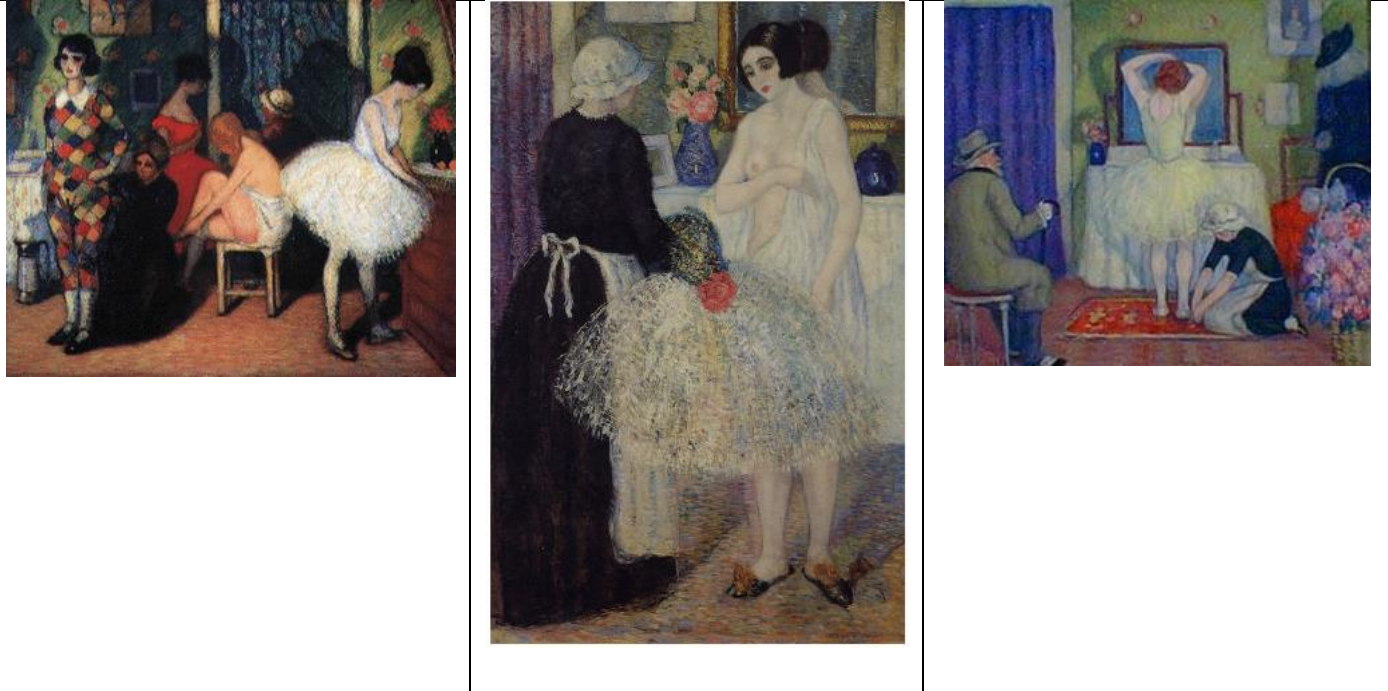
Figura 4. (Izq.) Valentín Thibon de Libian, La fragua (1916). Óleo sobre tabla, 85 x 78,5 cm, Museo Nacional de Bellas Artes / (Centro) (1920). Óleo sobre tela, 151 x 100 cm. Colección particular / (Der.) Valentín Thibon de Libian, Fifi l'Oiseau (1920). Óleo sobre tela, 55,8 x 64,3 cm, Museo Nacional de Bellas Artes

En clave de tema de encuadre las obras de Thibon de Libian, a diferencia de las escenas de toilette anteriormente vistas –salvo en el caso de Mantones de Manila –, nos permiten observar un doble mecanismo: si dicha categoría remite en un primer momento a «imágenes simbólicas, en las que un contenido determinado está relacionado con una cierta tendencia a dar formas generales» (Bialostocki, 1973, p. 158), lo que supone la incorporación de nuevos temas que se inscriben en la tradición; también conlleva que las formas de la iconografía tradicional puedan modificarse hasta tener tan sólo rasgos generales de aquella forma original. En estas obras la mujer no se encuentra en soledad al asearse: la intimidad del acto desaparece, quedando su cuerpo al descubierto frente a la mirada de los otros. Esto refuerza la posibilidad de comprender a esas mujeres representadas como prostitutas: son mujeres públicas, cuyos cuerpos son accesibles e inmorales.