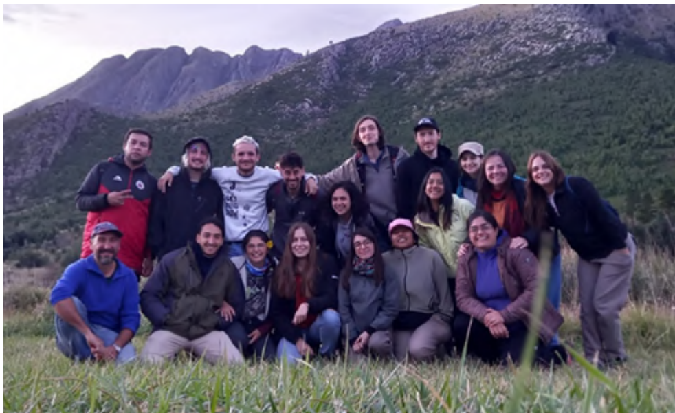
Figura 5. Cohorte 2022 MCH. Estudiantes y docentes del Curso de Manejo de Cuencas Hidrográficas frente al Parque Provincial Ernesto Tornquist, Sierra de la Ventana.

Como menciona Ibañez (2020) se observa que el proceso formativo que tuvo lugar en el 2020 (educación híbrida), producto de una emergencia sanitaria, se constituyó en una educación remota de emergencia) en donde se evidenciaron