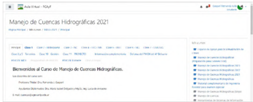
Figura 1. Aula Virtual MCH.

Es importante mencionar, que el curso de MCH, ya disponía de este espacio desde hace varios años atrás, pero actuaba como repositorio de material, donde los/las estudiantes encontraban los enunciados de los trabajos prácticos de las unidades temáticas, y debían enviar los informes de resolución de estos. Además, los docentes efectuaban las devoluciones correspondientes.