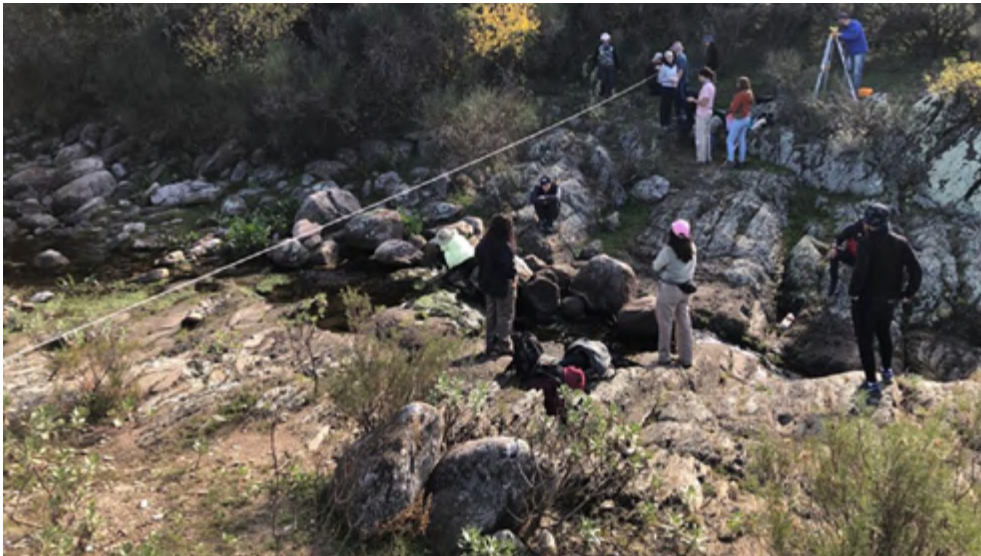
Figura 4. Cohorte 2022 MCH. Estudiantes y sus docentes en viaje integrador, realizando el perfil transversal sobre del cauce del A° Belisario con el objetivo de planificación de una propuesta de obra de retención/contención.

ambiental ilustrando la conservación y/o promoción en unidades territoriales definidas en cuencas hidrográficas serranas. Durante el desarrollo del viaje se indica y describe a los/las estudiantes las actividades a desarrollar en la zona en estudio, y se induce a aplicar conocimientos adquiridos al PMCH, donde las actividades desarrolladas permitieron generar y enriquecer la capacidad crítica y la mentalidad interdisciplinaria, avanzando en el ámbito conceptual, metodológico e instrumental en la comprensión del sistema de la cuenca y sus interrelaciones con la biodiversidad forestal, con el fin de poder abordar en unidad, problemáticas diversas, con determinados grados de complejidad, y dar respuestas creativas y reales, por medio de actividades extraordinarias en la currícula de la carrera de Ingeniería Forestal.