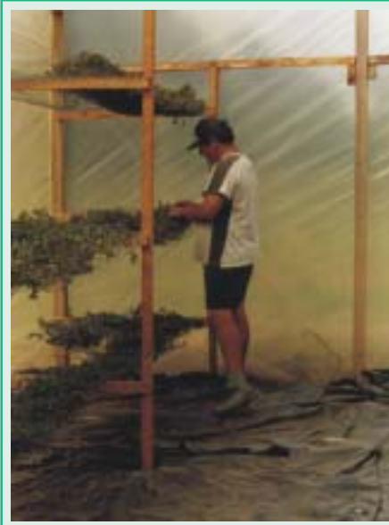
Figura 2 Interior del secadero.

Se ubica sobre el terreno con una orientación este-oeste para favorecer el mejor aprovechamiento de la radiación solar. La estructura puede realizarse con tirantes de madera, con un techo a un agua, recubierto en polietileno de 150 micrones de espesor. El frente y la parte posterior llevan aberturas regulables desarrolladas sobre una varilla giratoria, para facilitar y regular la circulación de aire, con apertura y cierre máximos de unos 50 cm. La ventana o abertura frontal podrá ubicarse a unos 40 cm del suelo y otra, en el borde superior del lado opuesto (Fig. 1).