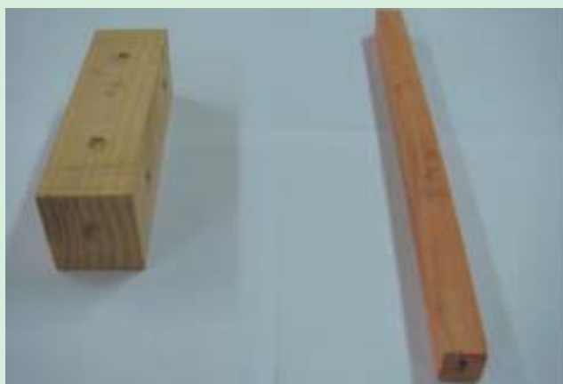
Probetas, dureza y flexión