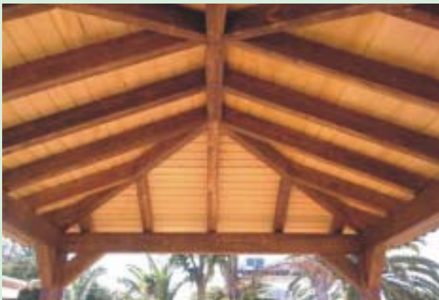
Estructura de techo