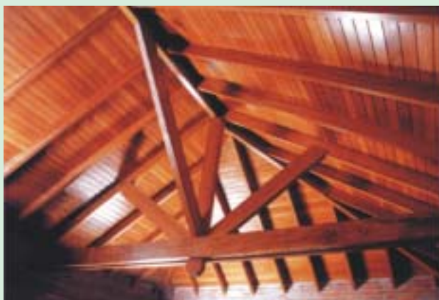
Estructura de techo