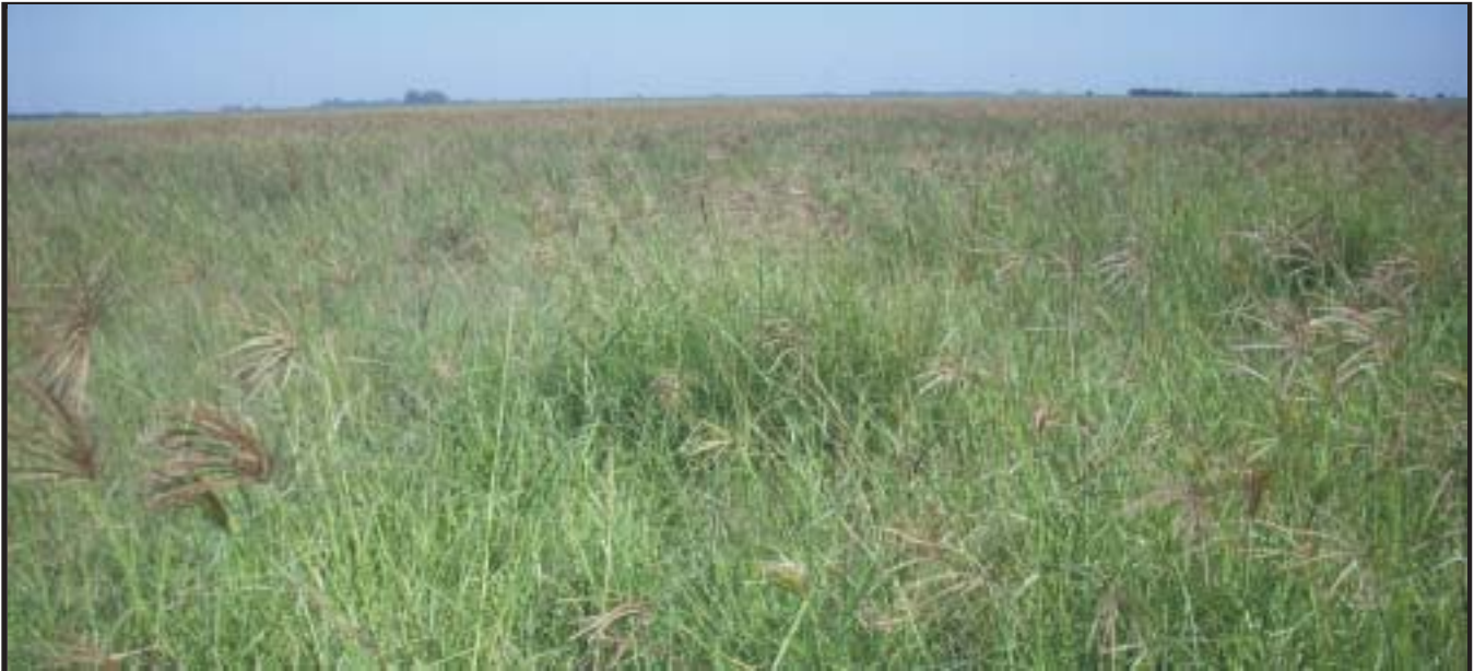
Grama rhodes

negativamente en la mayoría de los sitios, observándose un caso de desaparición total de la población.