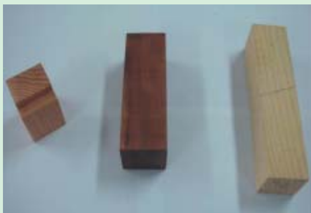
Probetas corte y compresiones

Los parámetros son obtenidos sobre probetas libres de defectos, por lo que, al diseñar una pieza para un uso determinado, se debe predecir la disminución de esa resistencia original debido a la presencia de defectos naturales de la madera como nudos, médula y grano inclinado, entre los más importantes en madera de uso estructural. La diferencia en los valores