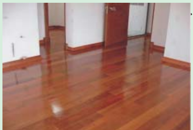
Probetas, dureza y flexión