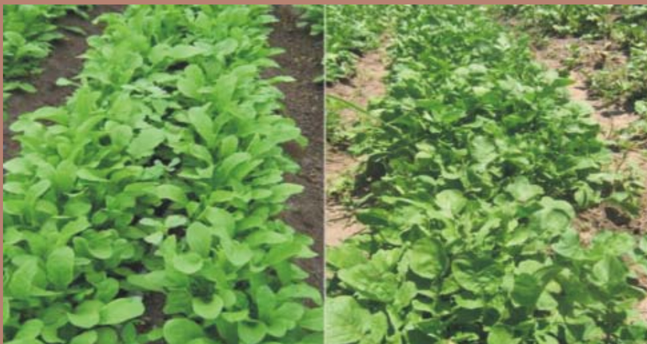
Fig. 1: Cultivo de rúcula en invernadero (izq) y al aire libre (der).

El cultivo se inicia de semilla, que es de origen nacional e importado, sin diferenciación de cultivares («rúcula cultivada»). Varias empresas la comercializan, y son de distintas características (Zorzi, Caps, Sais). También se puede hacer semilla propia fácilmente, dejando secar el fruto en galpón, ya que si no se abre y la semilla cae al suelo. La germinación es rápida y sin problemas en cualquier época del año, con temperaturas óptimas de 25° C a 27° C. Se disponen en hileras continuas de semillas sobre el surco, con distinta disposición según se trate de cultivos en invernadero o al aire libre. Se prefieren altas densidades, una buena cantidad de