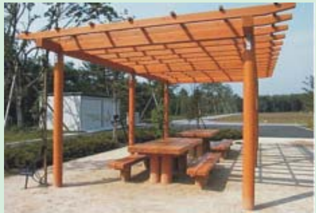
Pérgola, mesa y bancos