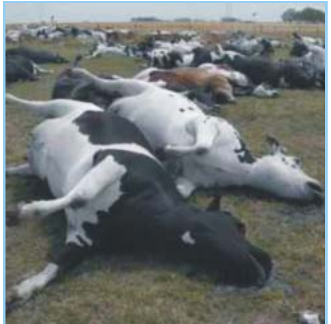
Imagen de vacunos muertos por carbunco bacteriano

Otras formas de contagio, mucho menos frecuentes, pero de mayor gravedad, son por consumo de carne poco cocida de animales infectados y por inhalación de esporas de la bacteria que origina el carbunco.