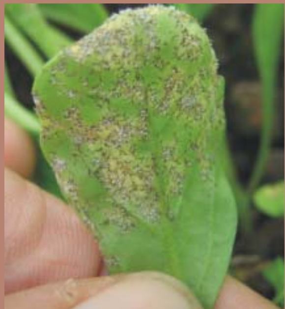
Fig. 2: Peronóspora de la rúcula