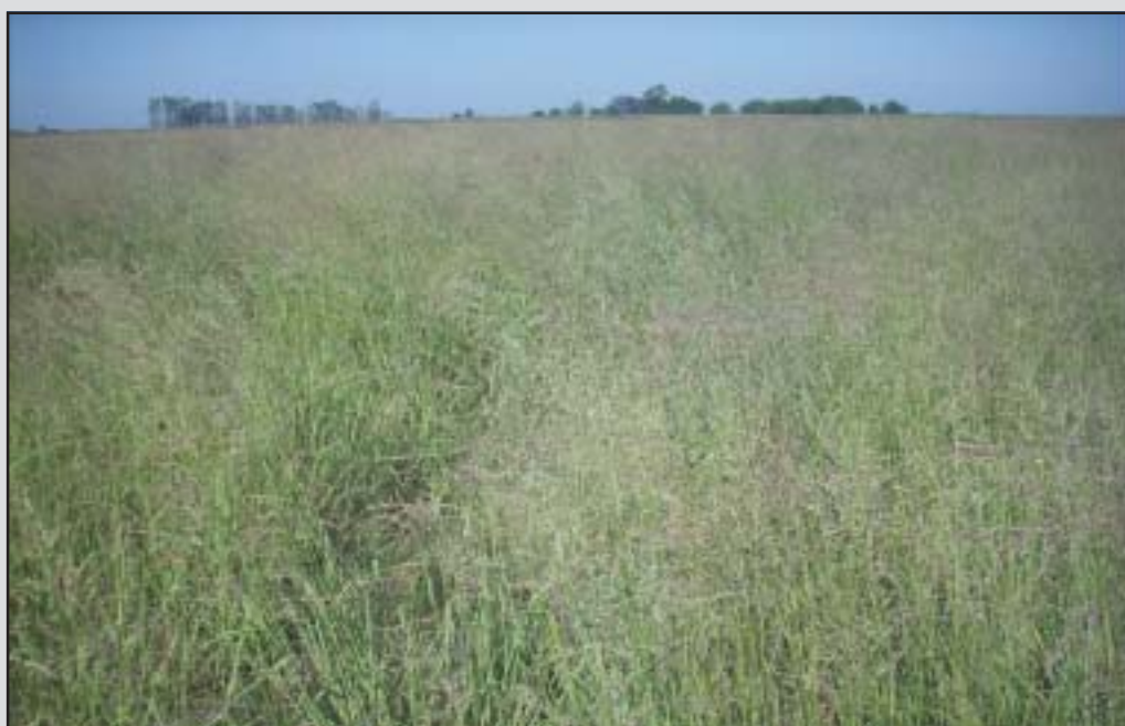
Mijo perenne

En gramma , especie que había tenido un mejor logro inicial, el estand de matas se vio afectado