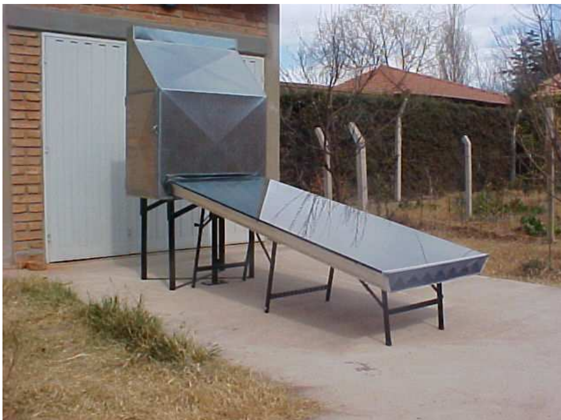
Figura 2 Vista fotográfica del secador construido, en la que se pueden apreciar las partes innovadoras: Un elevador mecánico simple (gato para automóvil) ubicado debajo del secador.

un equipo de tracción por medio de ruedas motorizadas con temporizador para seguir la trayectoria del sol y exponer optimamente el colector a la radiación solar