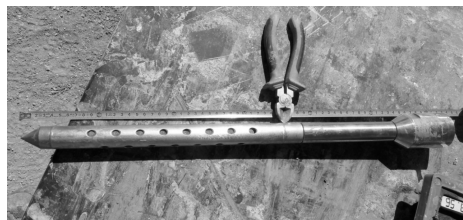
Figura 2. Muestreo mediante sistema drive-point

Las muestras de salmuera se tomaron a intervalos de aproximadamente 9 metros, o en su defecto cuando la litología atravesada lo permite. Las muestras recolectadas fueron envasadas en envases plásticos esterilizados y enviadas a los laboratorios de Alex Stewart, Mendoza. Un total de 352 muestras de drive-point fueron obtenidas para la caracterización del sistema del salar.