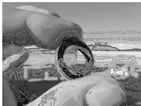
Figura 3. Membrana perforada permitiendo el ingreso de salmuera