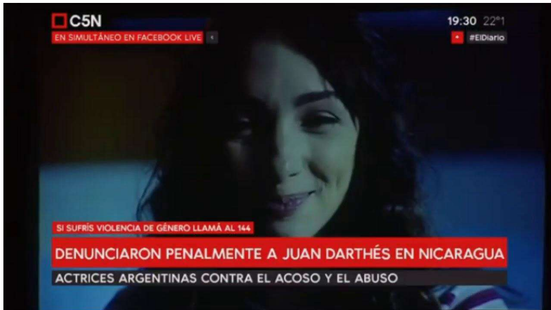
Figura N° 2. Captura de pantalla del video emitido durante la conferencia de prensa del Colectivo Actrices Argentinas, Ciudad Autónoma de Buenos Aires. Difundido por C5N en su cuenta de Youtube el 11 de diciembre de 2018.