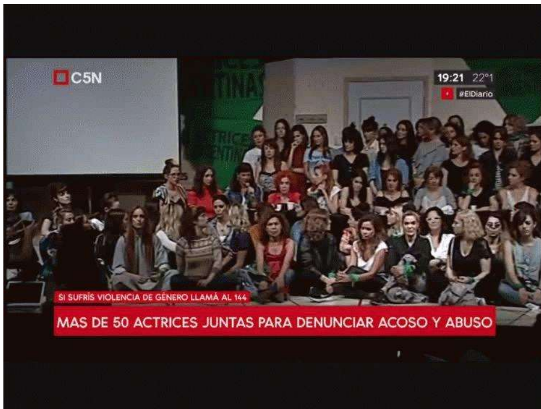
Figura N° 1. Captura de pantalla de la cobertura en vivo de la conferencia de prensa del Colectivo Actrices Argentinas, Ciudad Autónoma de Buenos Aires. Video difundido por C5N en su cuenta de Youtube el 11 de diciembre de 2018.