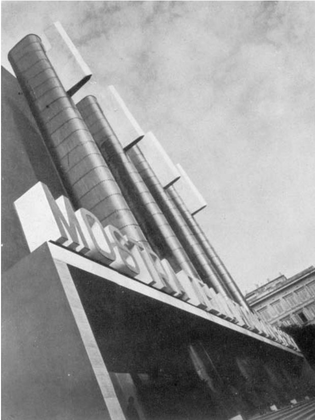
Figura 1. Fachada de la Muestra de la Revolución Fascista. Los cuatro elementos verticales realizados en acero y revestidos con láminas de cobre simbolizan el fasciolittorio con sus hachas.

«desinfección» operada tras eliminar al «bacilo socialista y comunista» 29 . Así y tras exaltar que la nación había sido salvada de «elementos subversivos», el mensaje instaba a las masas a ejercer una constante vigilancia para proteger las instituciones políticas, algo que en términos biopolíticos equivalía a preservar el estado de «inmunidad» alcanzado 30 .