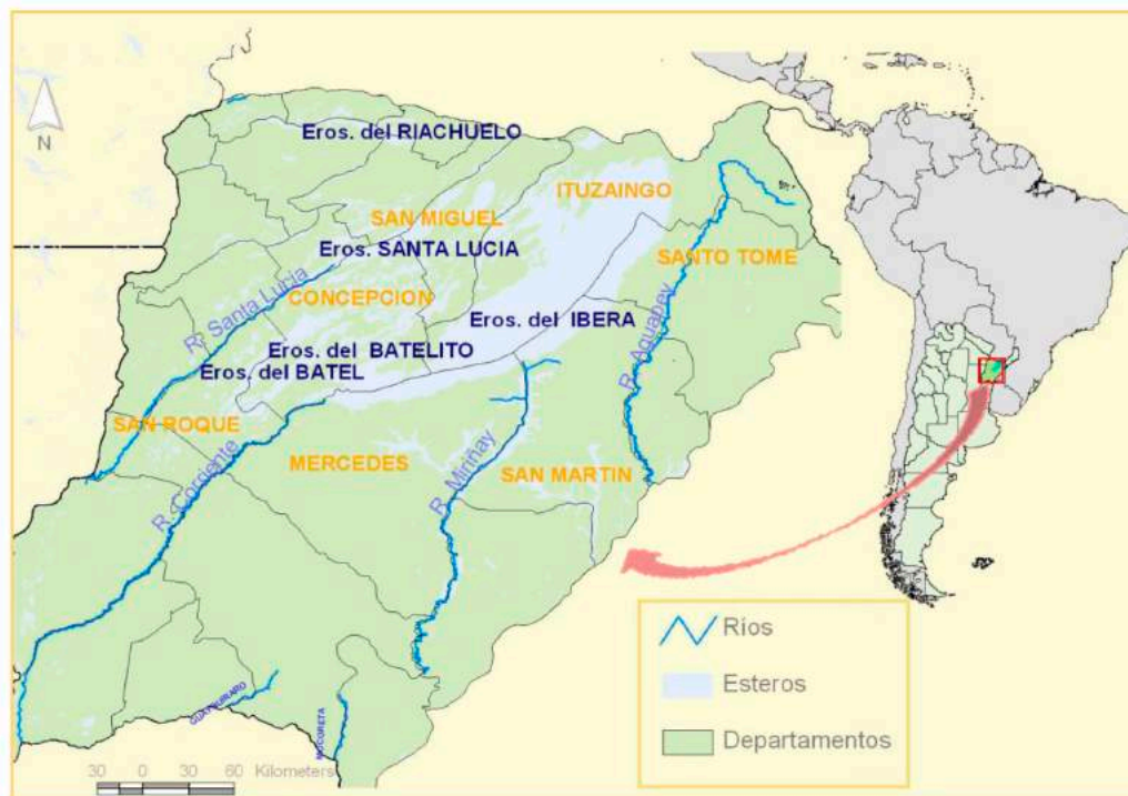
Mapa N° 1 Los Esteros del Iberá en la Provincia de Corrientes

Centro de Investigaciones Geográficas / Instituto de Investigaciones en Humanidades y Ciencias Sociales (UNLP - CONICET) Facultad de Humanidades y Ciencias de la Educación (FaHCE) Universidad Nacional de La Plata (UNLP)